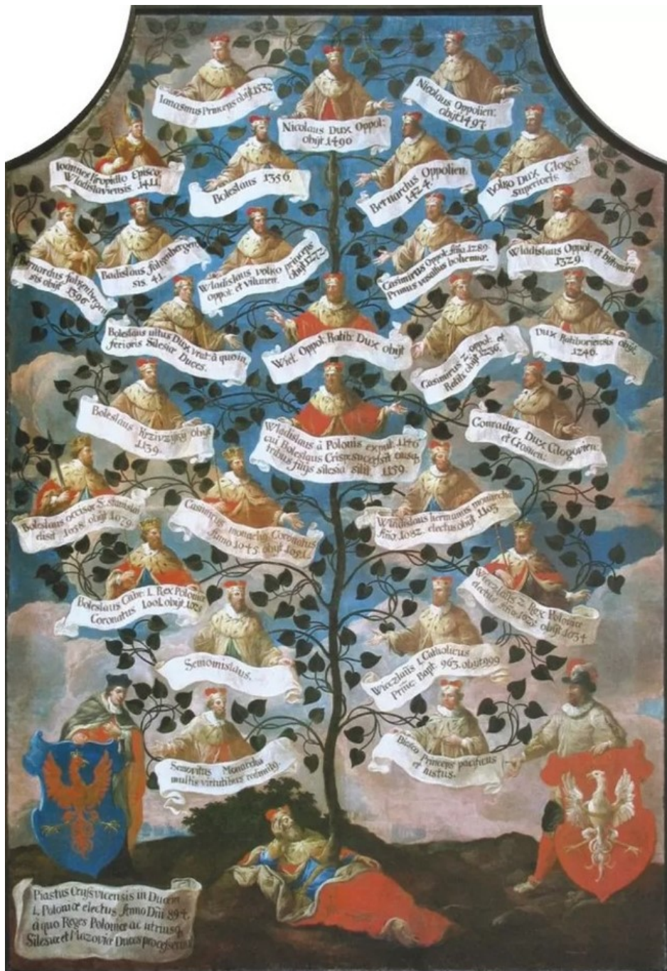
Drzewo Genealogiczne Piastów Opolskich ok. 1700 r. Katedra Świętego Krzyża w Opolu, Fot. K. Adamus

ważnym wydarzeniem stało się przeniesienie do katedry z kościoła „na górze” obrazu Matki Boskiej Piekarskiej (Opolskiej).