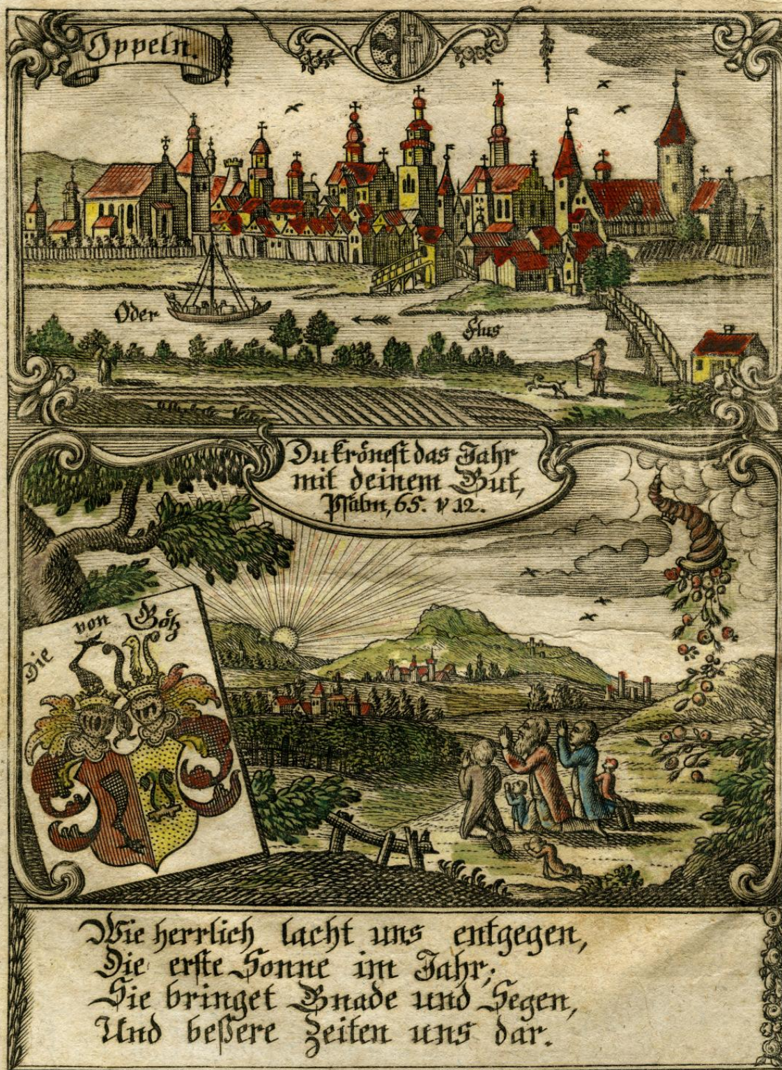
Grafika z archiwum Muzeum Śląska Opolskiego