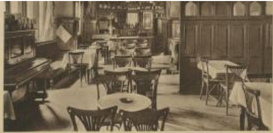
Café und Conditorei Ernst Schwigen, Oppeln, Strasse 2, Ecke Mühlstr. Tel. 44.