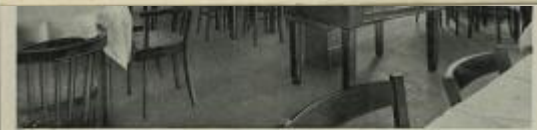
Gaststätte „Odermühle“ Inh. W. Klose - Oppeln, O.-S.