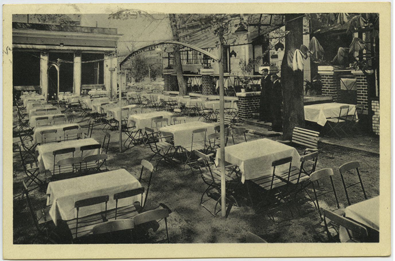
Restauracja „Eiskeller” przy ulicy Piastowskiej 17 ( ob. w tym miejscu mieści się Instytut Śląski).