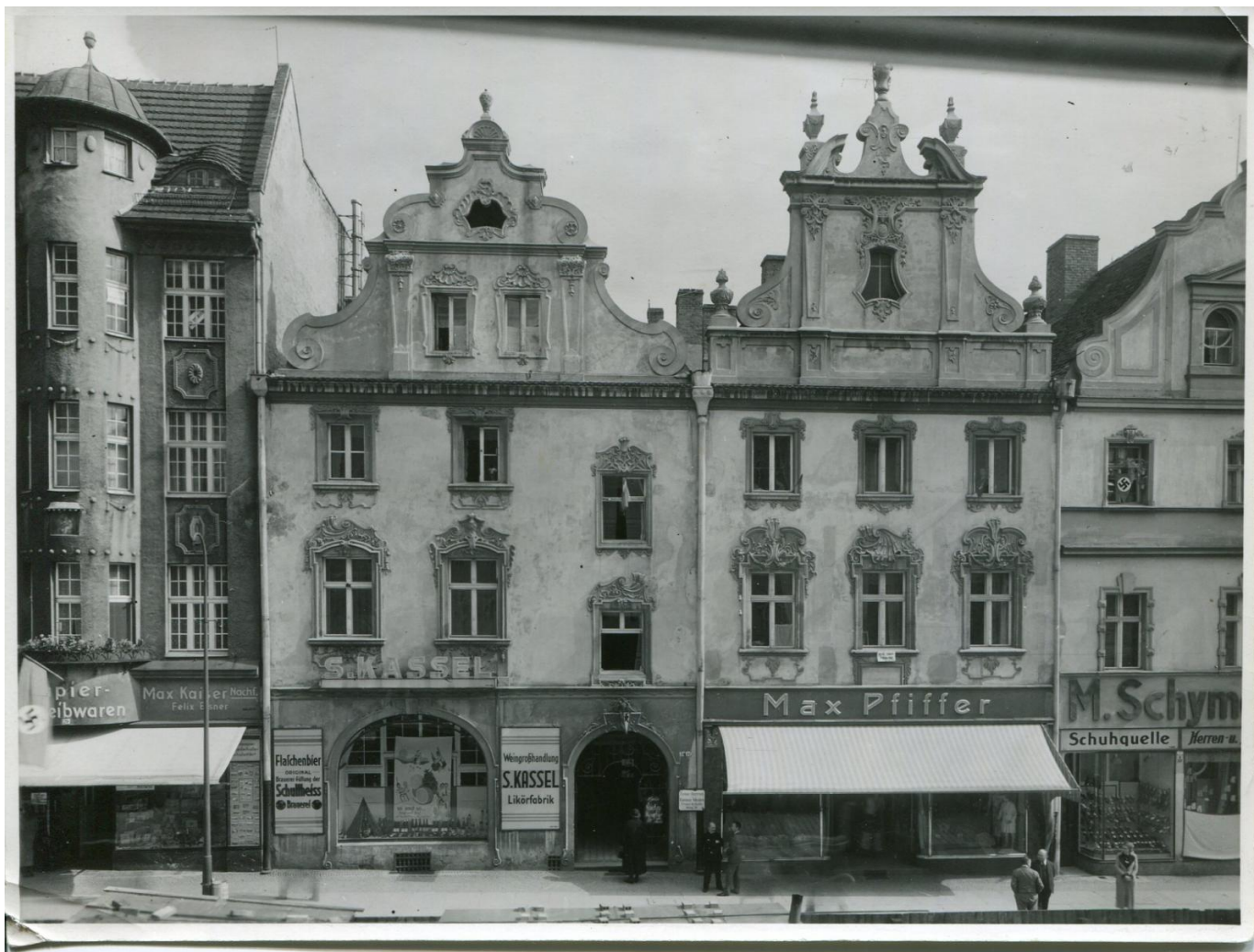
Południowa pierzeja rynku, lata 30. XX wieku