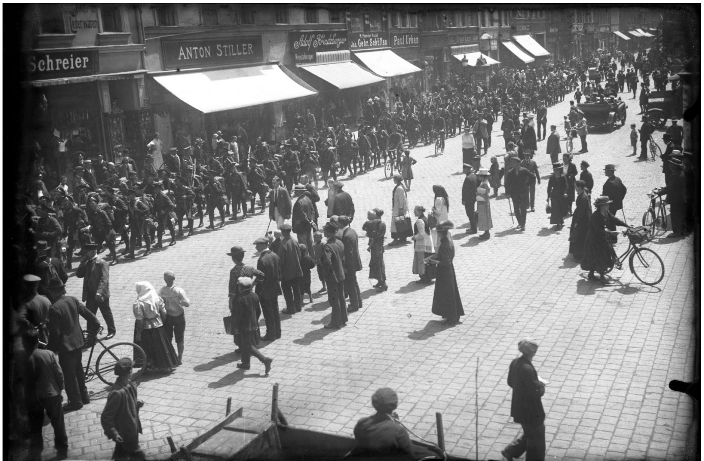
Przemarsz wojsk i uroczystości na rynku w okresie plebiscytowym, ok. 1921 roku