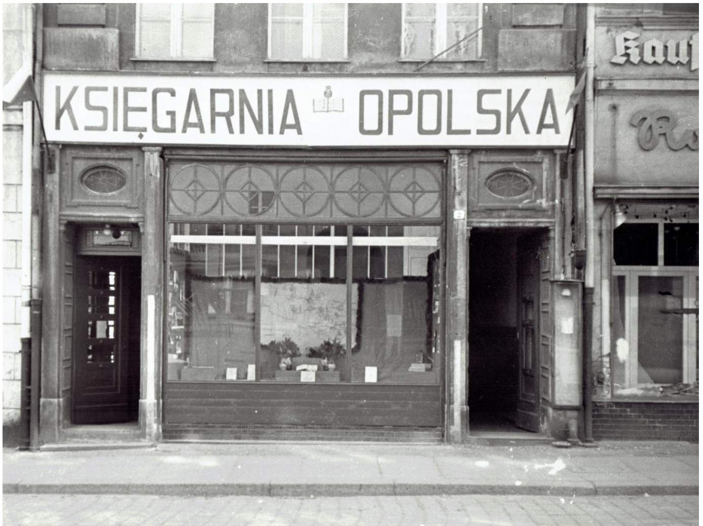
Księgarnia Opolska, Rynek 2, fot. L. Olejnik ok. 1946 roku