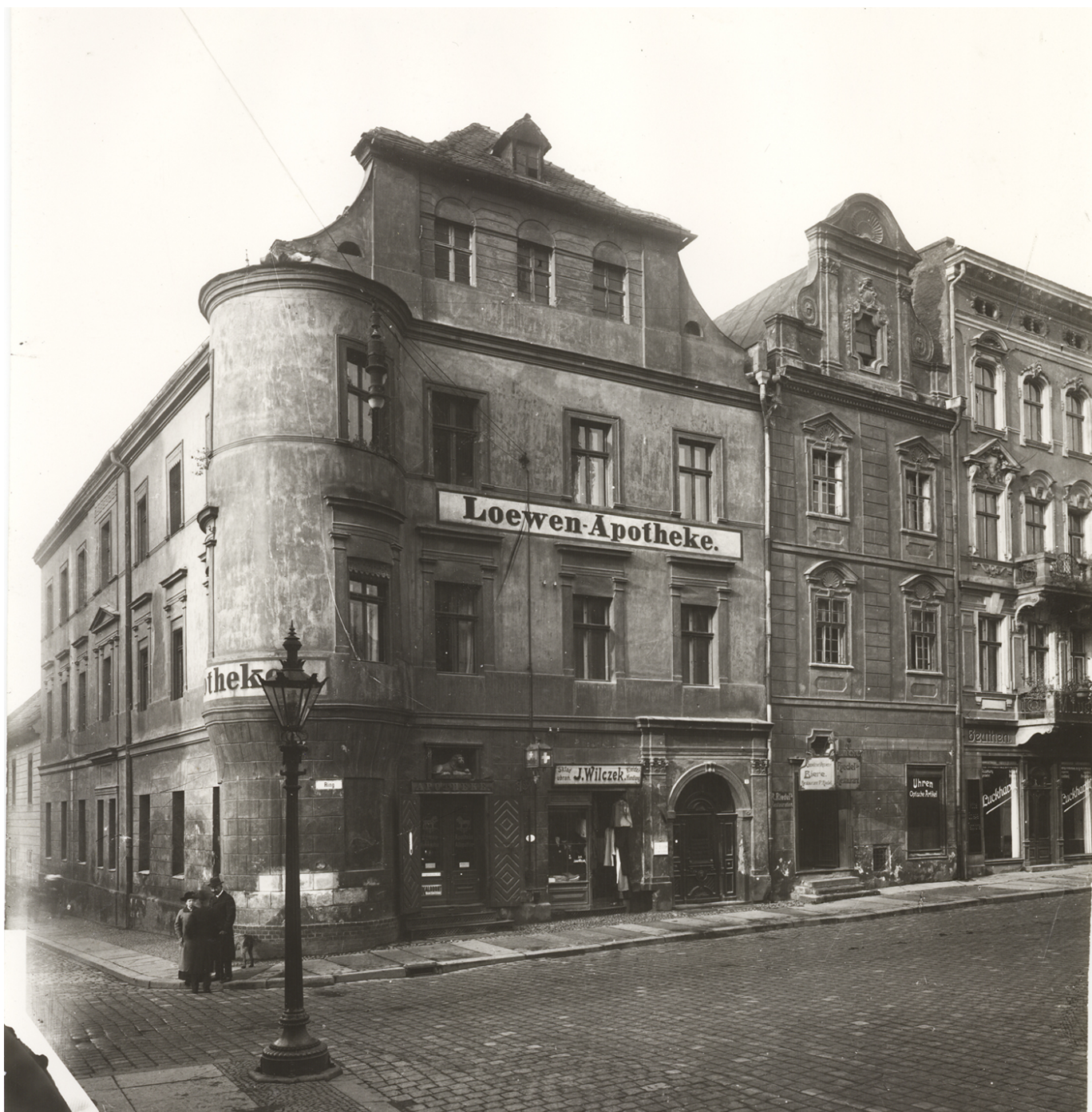
Rynek 1-3. W budynku nr 1 od ok. 1824 roku mieściła się apteka „Pod Lwem”, 1912 rok