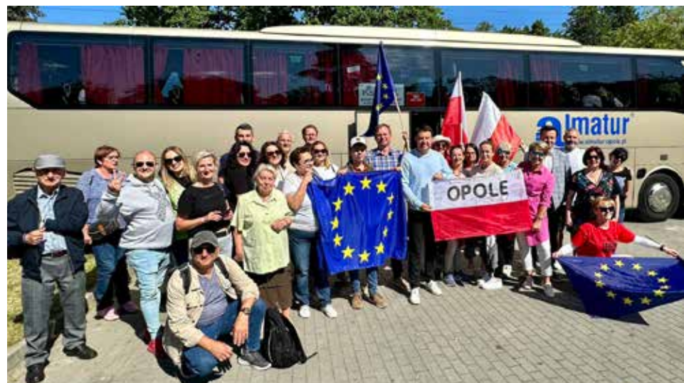
Wśród kilkudziesięciu autokarów z Opolszczyzny był również nasz, sfinansowany przez uczestników