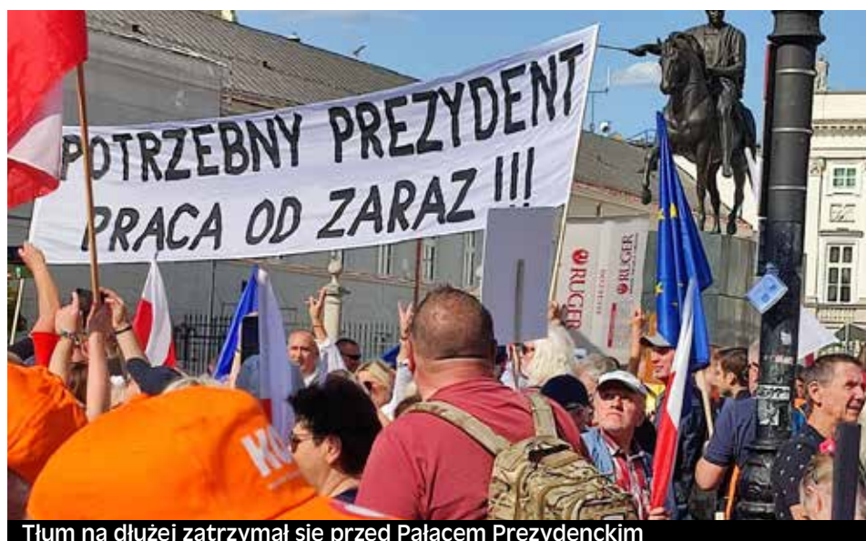
Tłum na dłużej zatrzymał się przed Pałacem Prezydenckim