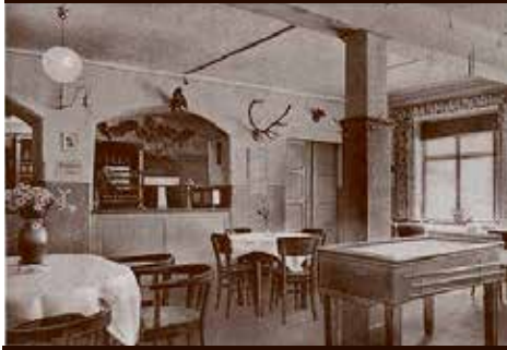
Gospoda Odermuhle, właściciel W. Kloze