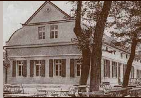
Restauracja na wyspie Bolko