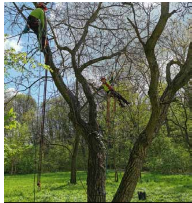
Rozwidlenie orzecha z rozszczelnieniem, które wymusza stosowanie wiązań statycznych

Dział Zieleni Miejskiej Zakładu Komunalnego w Opolu