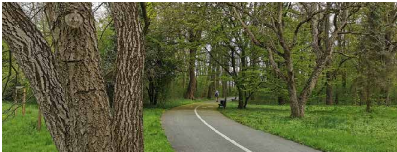
„Orzechowe wrota” – para orzechów włoskich w Parku na Wyspie Bolko