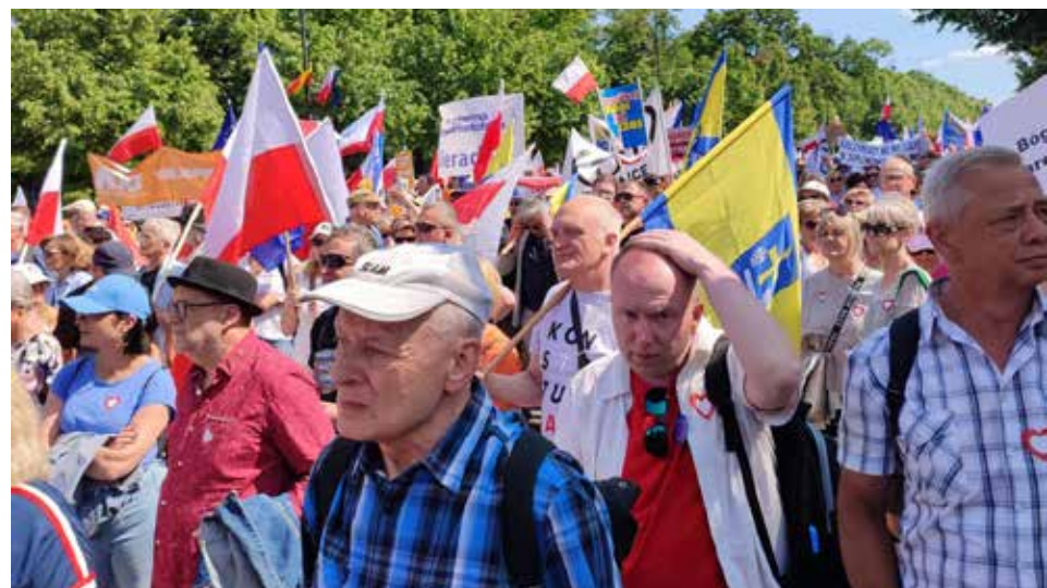
Idziemy Alejami Ujazdowskimi, przez Plac Trzech Krzyży, Nowym Światem, Krakowskim Przedmieściem na Plac Zamkowy