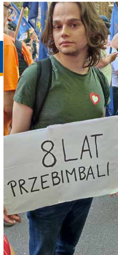
Ludzie przynieśli ze sobą plakaty, zrobione domowym sposobem