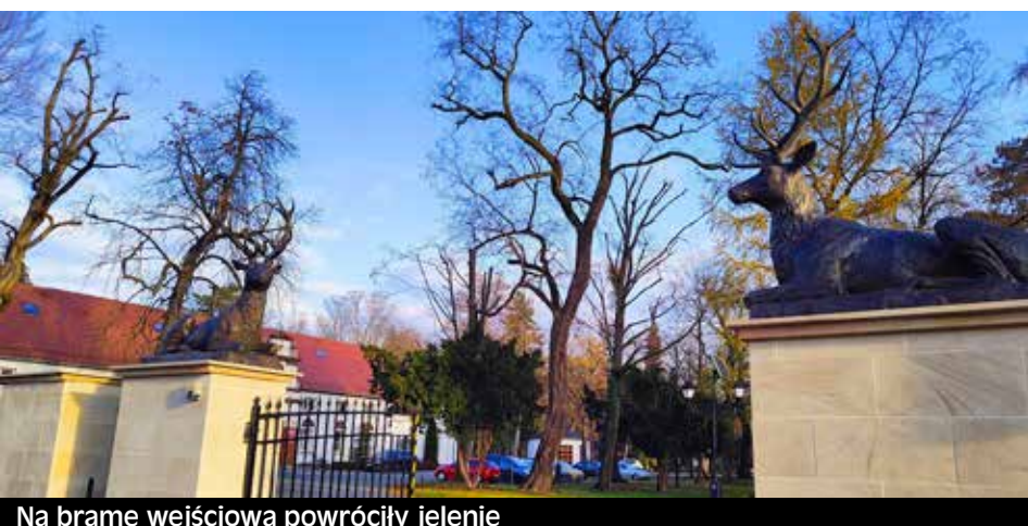
Na bramę wejściową powróciły jelenie