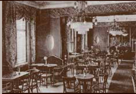
Kawiarnia Residenz, ul. Książąt Opolskich