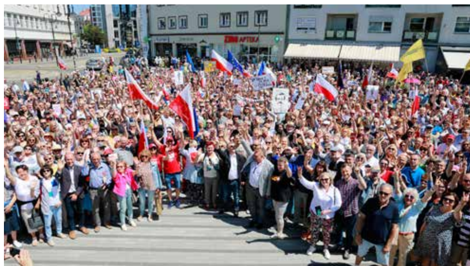
Ludzie manifestowali także w innych miastach. Opolanie zgromadzili się na placu Wolności