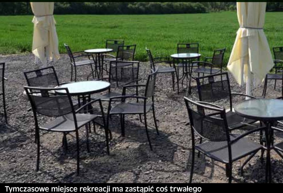
Tymczasowe miejsce rekreacji ma zastąpić coś trwałego

– Tylko samo zoo odwiedza rocznie około 400 tysięcy osób, do tego dochodzą niepoliczalne tłumy odpoczywających w samym parku – ar-