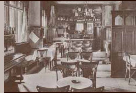
Kawiarnio-cukiernia Ernsta Schwigna przy Sternstrasse 8,

Jak wyglądał restauracyjny krajobraz Opola (Oppeln) na przełomie XIX i XX wieku? Kawior astrachański i wyśmienite mięsa „ładowały” na stołach najbardziej wykwintnych lokali. Wieprzowina, gęsina oraz nieśmiertelne flaki i bigos w mniej eleganckich knajpkach. A z zapitków królowały oczywiście piwa. Najczęściej z lokalnych browarów, zwłaszcza namysłowskiego.