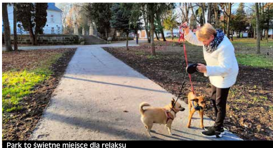
Park to świetne miejsce dla relaksu

Pierwsza ziemianka jest dużo głębsza i ma przepuszczalną podłogę, żeby woda z lodu używanego do chłodzenia, wycinanego z pobliskich stawów, mogła w miarę topnienia wsiąkać w glebę. Przechowywano tam mięso i produkty wymagające niższych temperatur. Drugie pomieszczenie, znacznie płytsze, pełniło funkcję spiżarni, w któ-