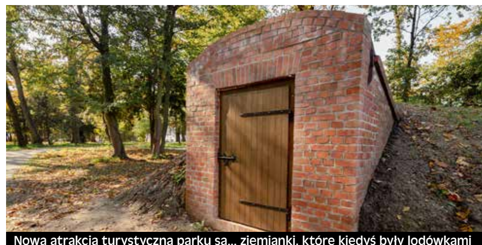
Nową atrakcją turystyczną parku są... ziemianki, które kiedyś były lodówkami