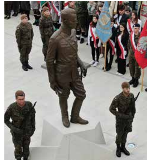
W OPOLU STANĄŁ POMNIK ROTMISTRZA PILECKIEGO