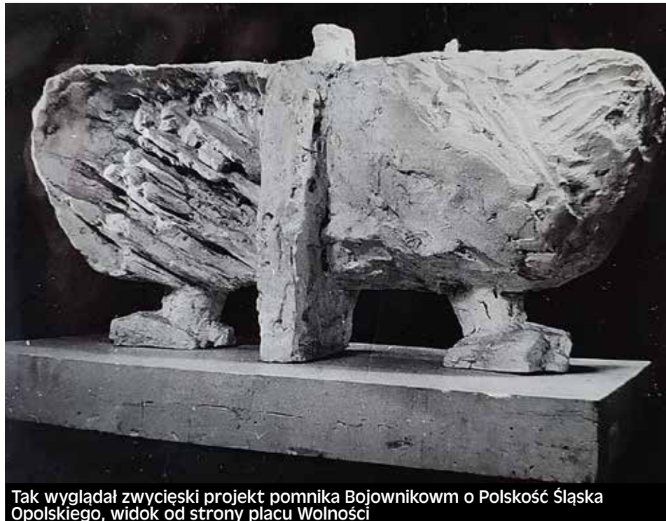
Tak wyglądał zwycięski projekt pomnika Bojownikom o Polskość Śląska Opolskiego, widok od strony placu Wolności

Wszystko sam finansowałem. Trzynastą emeryturę oddałem dla dzieci niepełnosprawnych intelektualnie, ale już 14. poszła na prace nad tym projektem Pola Pamięci. Wie pan, te 13., 14. emerytury uznaję jako łapówkę władzy dla społeczeństwa, a ja nie jestem przekupny. Żyjemy naprawdę w paskudnych czasach, nigdy bym się nie spodziewał, że na stare lata historia Polski zatoczy takie koło.