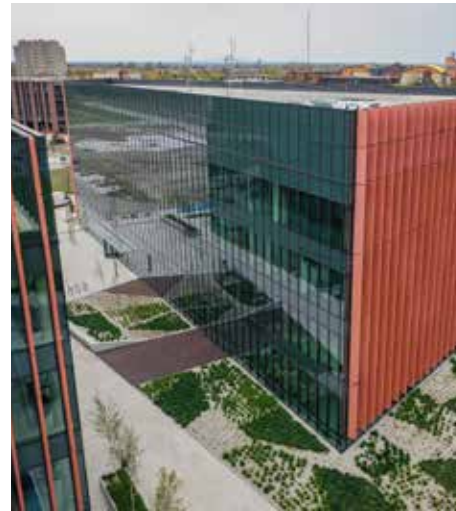
DO NOWEGO RATUSZA PRZENOSZĄ SIĘ KOLEJNE WYDZIAŁY UM