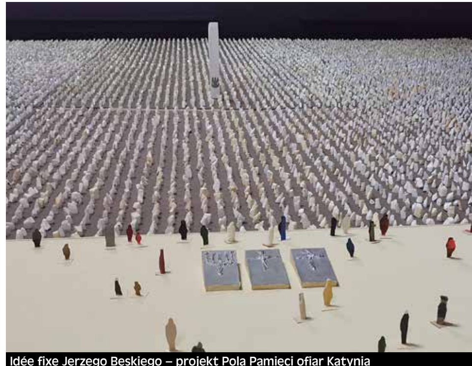
Idee fixe Jerzego Beskiego – projekt Pola Pamięci ofiar Katynia