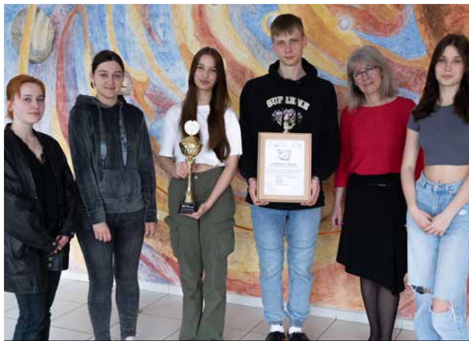
Przepustką do wyjazdu na finał do USA było drugie miejsce w finale krajowym

– Te zawody mają szczególne znaczenie, bowiem są swoistym sprawdzianem kompetencji uczniów na wielu płaszczyznach. Młodzież musi zastosować poznaną wiedzę, a jednocześnie powinna znaleźć nietypowe rozwiązania dla przedstawionych problemów. Celem Odysei jest rozwój zdolności twórczych młodych ludzi – podkreśla