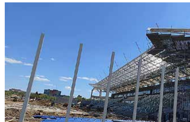
Stadion Radomiaka Radom