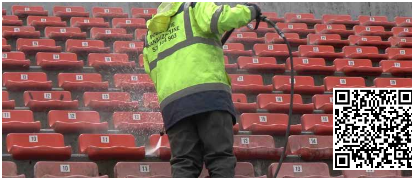
Wyczyszczenie stadionowych krzesełek to w gruncie rzeczy prezent o wartości 40 tysięcy złotych

Krzesełka na stadionie piłkarskim Odry Opole zostały „wykąpane” dzięki inicjatywie kibiców. Czyszczenie okazało się szczęśliwe, tuż po nim Odra pokonała Chrobrego Głogów.