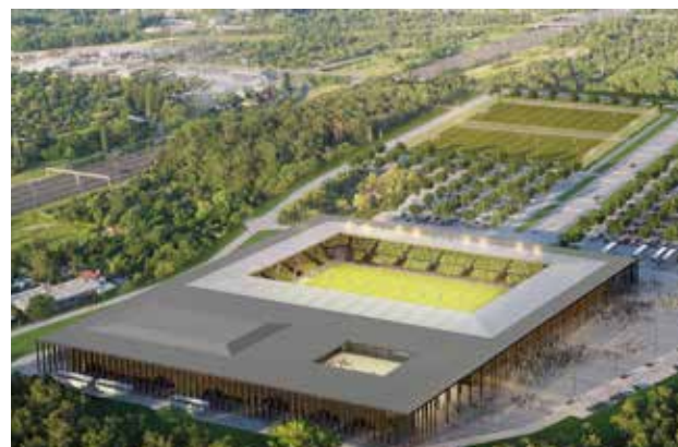
Wizualizacja Stadionu Miejskiego w Katowicach