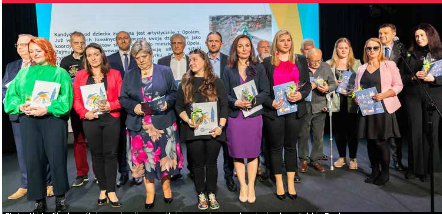
Statuetki trafiły do osób i organizacji szczególnie zaangażowanych w życie obywatelskie Opola.

stwa w Opolu. Od 2011 roku wielokrotnie była współorganizatorem letniego wypoczynku dla dzieci funkcjonariuszy i pracowników więziennictwa. Od kilku lat jest przewodniczącą Funduszu Pomocy Doradź przy Zarządzie Głównym NSZZ FiPW oraz przewodniczącą Funduszu Pomocowego przy Centralnym Zarządzie Służby Więziennej w Warszawie