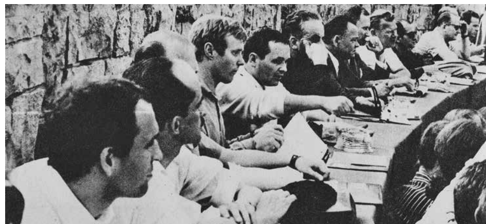
Jury II KFPP obraduje