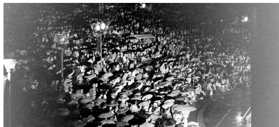
Deszcz jest częstym towarzyszem festiwalowych koncertów