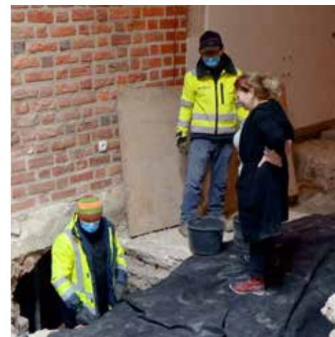
Prace przy wykopach fundamentowych wymagają wyjątkowej precyzji