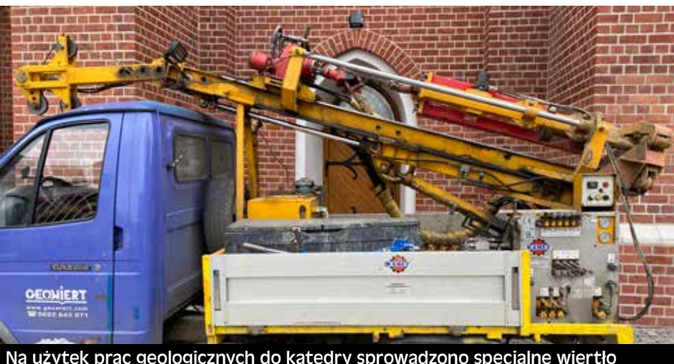
Na użytek prac geologicznych do katedry sprowadzono specjalne wiertło

W 491 rocznicę śmierci opolskiego księcia Jana Dobrego rozpoczęły się w opolskiej katedrze badania geo-wiertnicze.