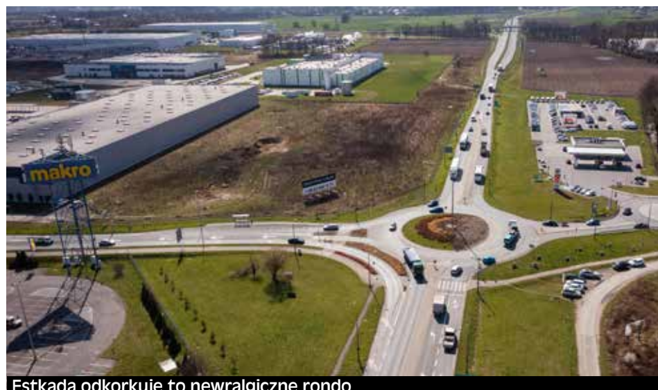
Estakada odkorkuje to newralgiczne rondo

Program funkcjonalno-użytkowy to pierwszy krok przeprowadzenia prac. Pozwo-