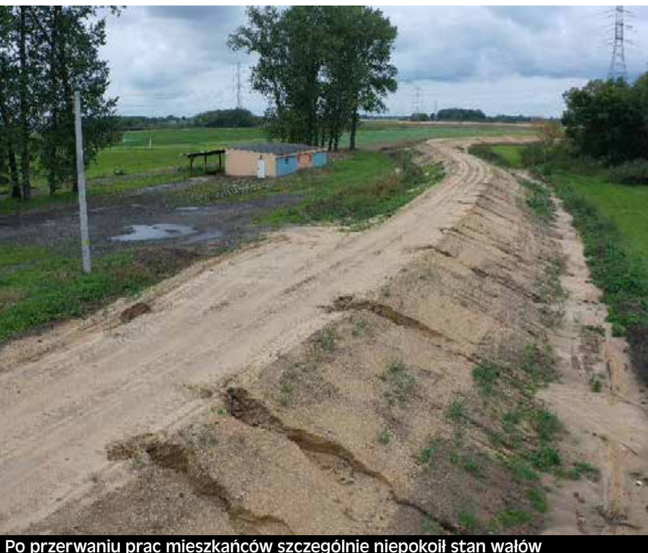
Po przerwaniu prac mieszkańców szczególnie niepokoił stan wałów

W październiku 2022 roku Wody Polskie odstąpiły od umowy z dotychczasowym wykonawcą inwestycji. Nieterminowość i „nieuzasadnione roszczenia finansowe” – to główne powody, z jakich Państwowe Gospodarstwo Wodne Wody Polskie zrezygnowały z usług firmy ETP S.A. w Katowicach przy budowie Polderu Żelazna. Po pół roku podpisano umowę z nowym wykonawcą.