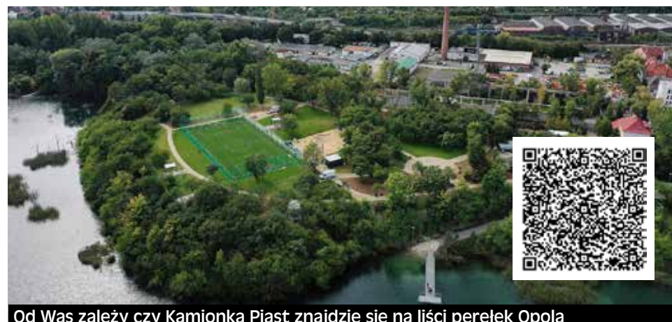
Od Was zależy czy Kamionka Piast znajdzie się na liści perełek Opola

W propozycjach znalazło się kilka obiektów sportowych oraz służących rekreacji, takich jak: Toyota Park, Wodna Nuta, czy Kamionka Piast. Nowoczesna hala sportowa z podwieszaną bieżnią i kompleksem boisk, to sportowe centrum miasta, które tętni życiem i cieszy się ogromną popularnością mieszkańców. Toyota Park dodatkowo w sezonie zimowym zamienia się w lodowisko pod chmurką. Wodna Nuta, to pływalnia z torami o długości 50 metrów, która w momencie otwarcia – w 2013 roku, była jednym z niewielu takich basenów w kraju. A zrewitalizowanie Kamionki Piast sprawiło, że w centrum miasta i dzięki nowemu zagospodarowaniu terenu mieszkańcy zyskali przestrzeń do wypoczynku i rekreacji. Powstały tu: boiska i place zabaw, ścieżki pieszo-rowerowe, punkty widokowe oraz wybiegi dla psów.