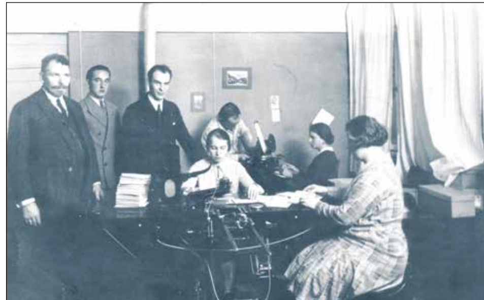
Rok 1932, druk ulotek wyborczych w centrali Związku Polaków w Niemczech