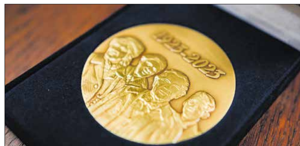
Z okazji jubileuszu I Dzielnicy ZPwN w Opolu miasto wybiło pamiątkowy medal