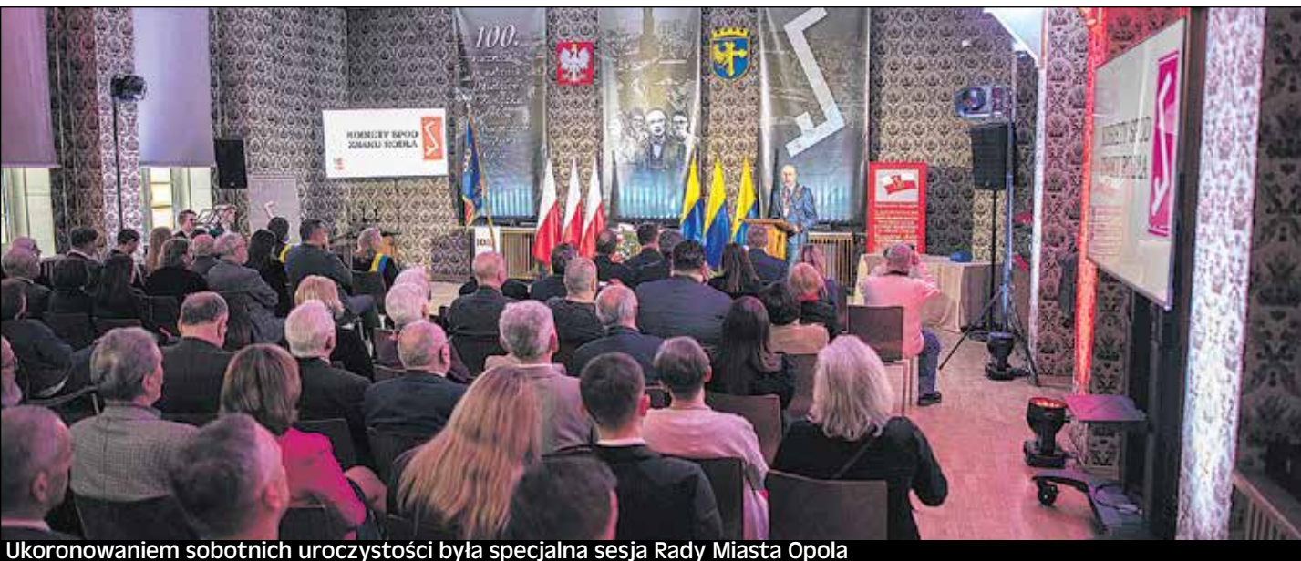
Ukoronowaniem sobotnich uroczystości była specjalna sesja Rady Miasta Opola

18 lutego 1923 roku, powstała Dzielnica I Związku Polaków w Niemczech z siedzibą w Opolu. Z tej okazji w ubiegły weekend trwały w Opolu uroczyste obchody stulecia tego wydarzenia.