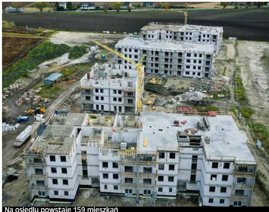
Na osiedlu powstaje 159 mieszkań

Wyznaczone dla najemców kryteria dochodowe praktycznie wszystkim mieszkańcom osiedla