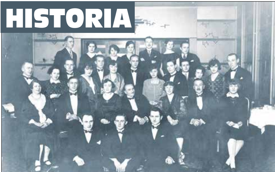
Pracownicy Konsulatu II RP w Opolu