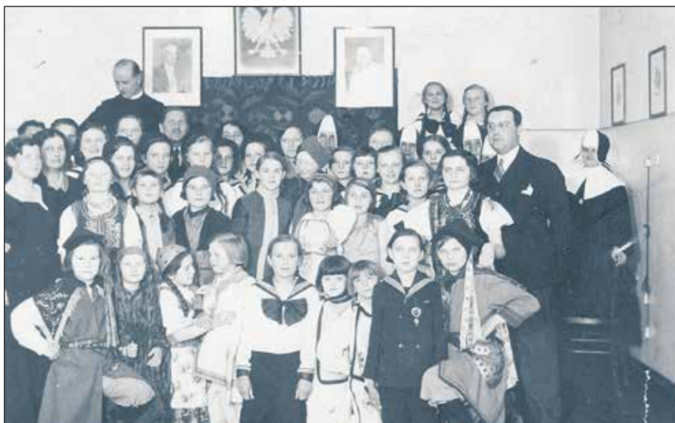
19 marca 1934 uroczystości w Tarnowskich Górach z okazji imienin Piłsudskiego