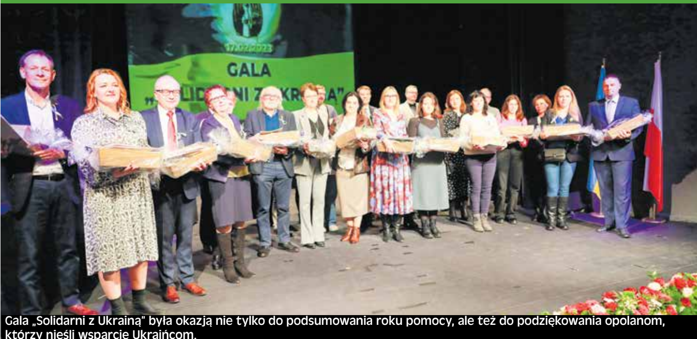
Gala „Solidarni z Ukrainą” była okazją nie tylko do podsumowania roku pomocy, ale też do podziękowania opolanom, którzy nieśli wsparcie Ukraincom.

Opole uhonorowało opolan, którzy od roku pomagają uchodźcom z Ukrainy. Wśród nagrodzonych są osoby prywatne, organizacje pozarządowe, instytucje publiczne a także firmy.