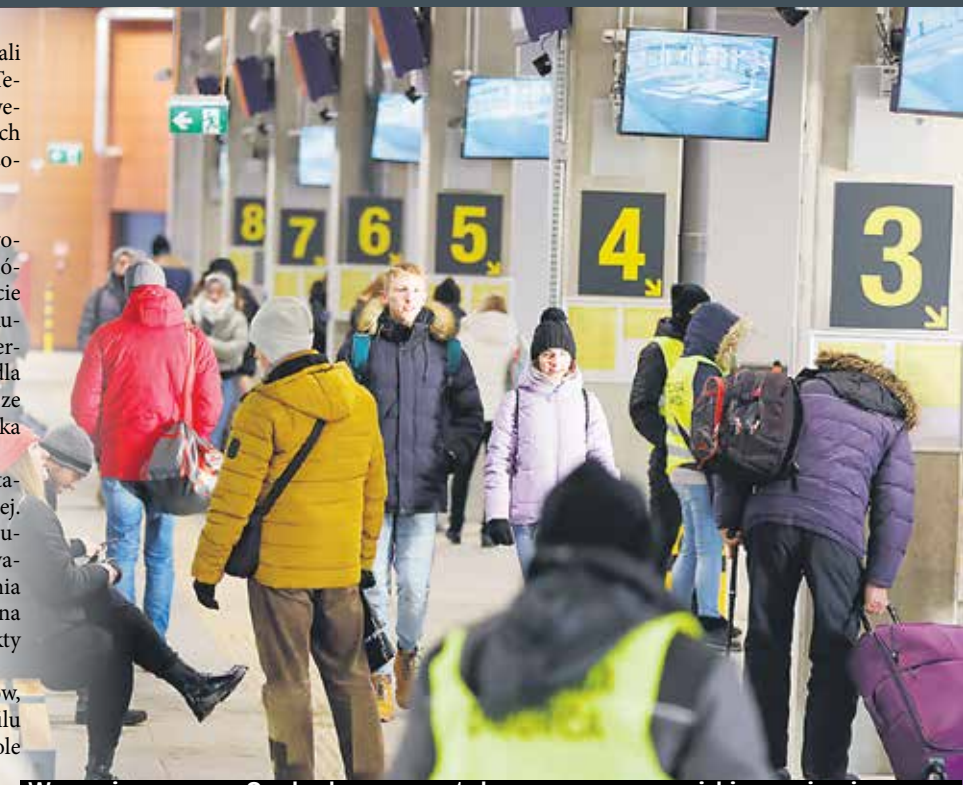
Wreszcie mamy w Opolu dworzec autobusowy na europejskim poziomie

Informacje dotyczące odjazdów autobusów, a także regulamin dworca można znaleźć na profilu facebookowym Centrum Przesiadkowego Opole Główne.