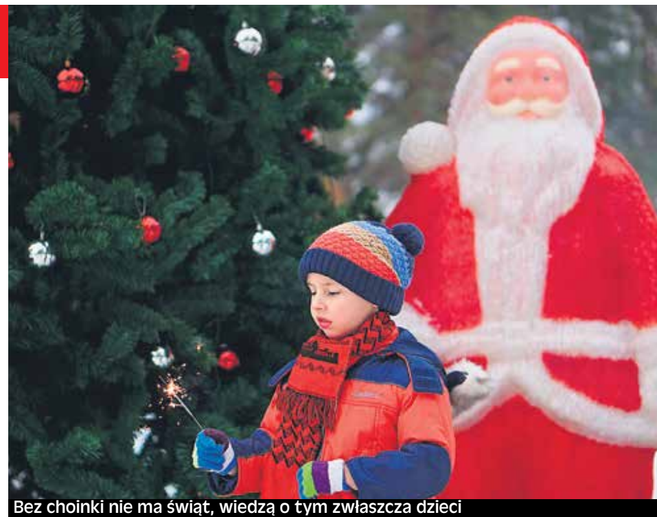
Bez choinki nie ma świąt, wiedzą o tym zwłaszcza dzieci

Każdy ma swój gust, więc trudno mi doradzać, ale mogę podpowiedzieć, co zrobić, żeby choinka w domu wytrzymała jak najdłużej. Po pierwsze – choinka musi mieć dostęp do wody. Są dwie szkoły: nowoczesne stojaki, które mają