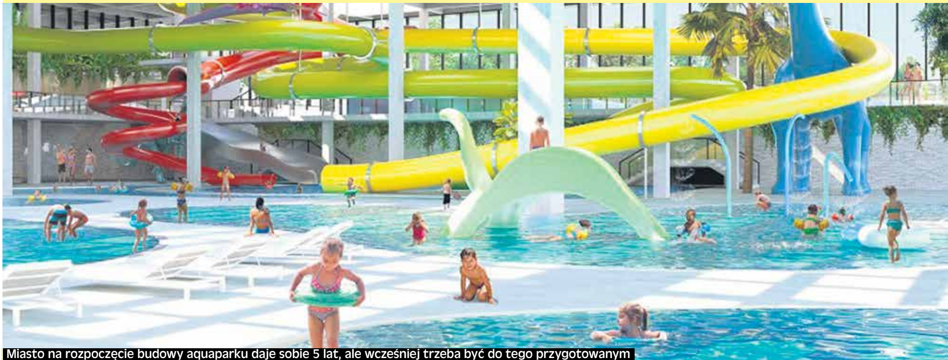
Miasto na rozpoczęcie budowy aquaparku daje sobie 5 lat, ale wcześniej trzeba być do tego przygotowanym