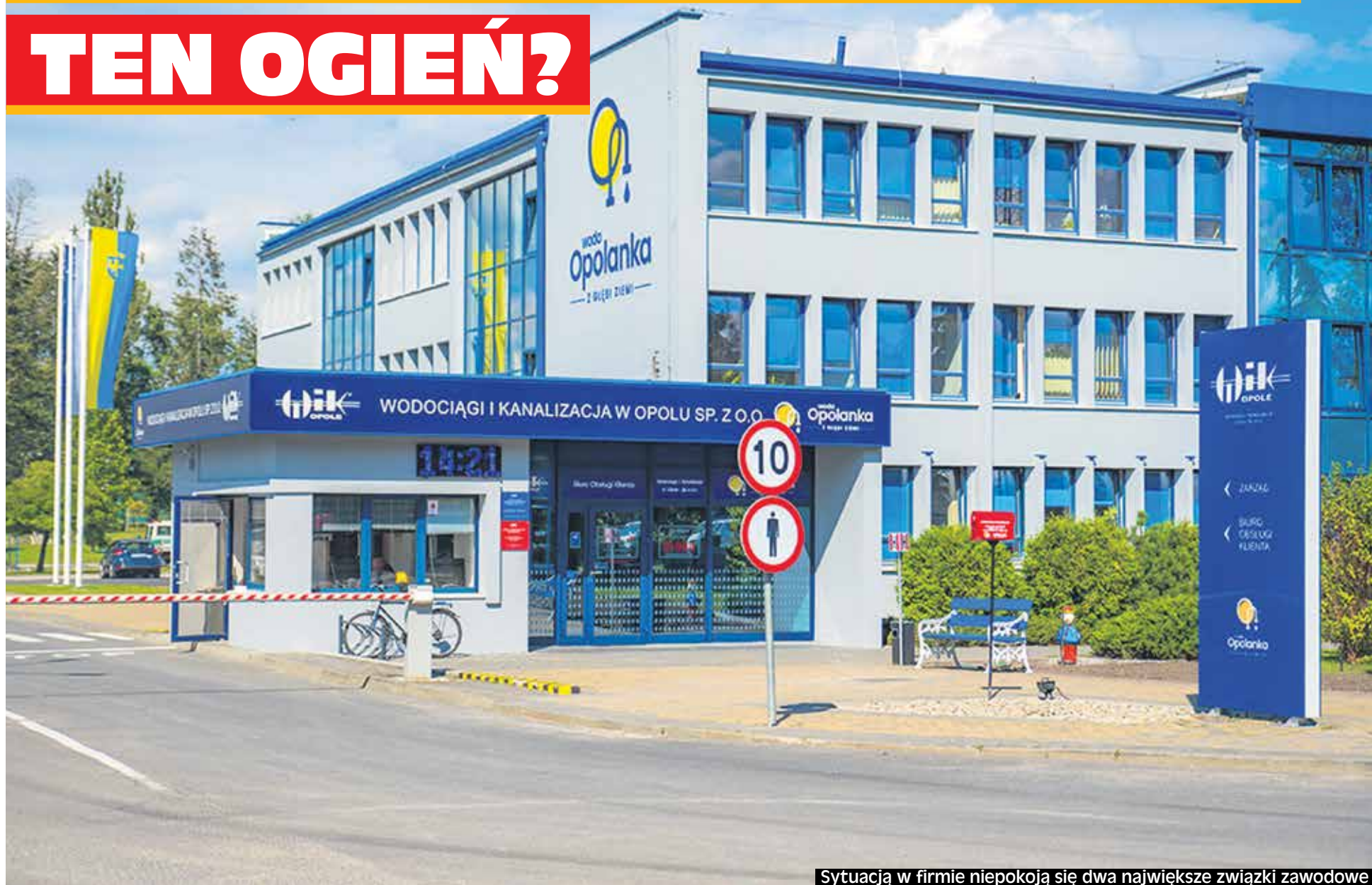
Sytuacją w firmie niepokoją się dwa największe związki zawodowe