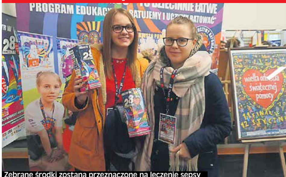
Zebrań środki zostaną przeznaczone na leczenie sepsy

31. finał Wielkiej Orkiestry Świątecznej Pomocy zbliża się wielkimi krokami.. W tym roku wolontariusze będą zbierać pieniądze na leczenie sepsy. W sztabach regionalnych skończyły się naborzy na zimowy finał.