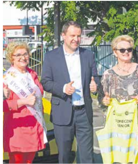
Wysoka ocena prezydenta Wiśniewskiego > 3