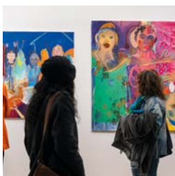
Salon Wiosenny 2024 zaprasza! strona 18-19