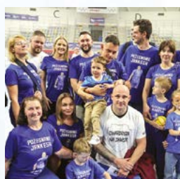
Dwa kluby – dwa spojrzenia strona 32-34