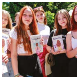
Festiwal Książki już po raz ósmy strona 8-9