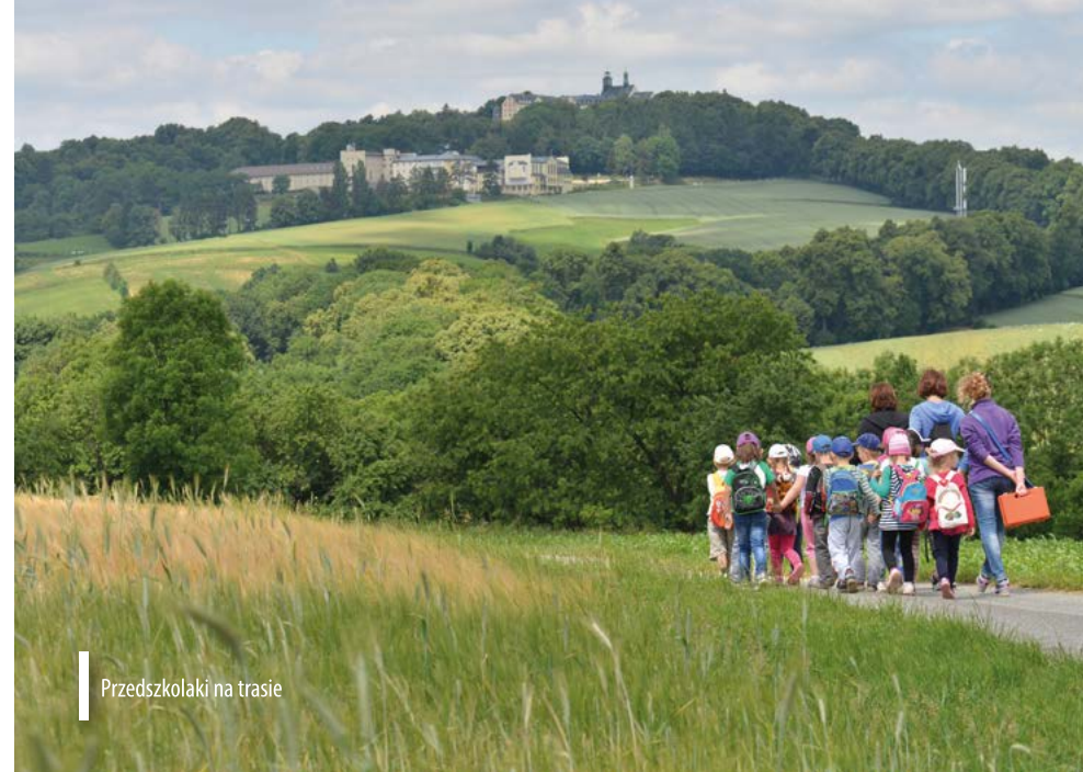
Przedszkolaki na trasie

go, szlak niebieski Powstańców Śląskich, szlak zielony Flory i Fauny, szlak żółty im. Xawerego Dunikowskiego. To trasy liczące od 3 aż do prawie 50 kilometrów - dla sprawnych piechurów. Prawie każda z wymienionych tras oferuje wycieczkę przepięknymi leśnymi traktami, w niektórych z nich turyści odnajdą zabytki, takie jak m.in. bazylikę, Grotę Lurdzką, muzea, kalwarię, amfiteatr skalny czy geostanowisko nefelinitów, czyli magmowych skał wulkanicznych.