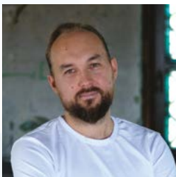
Śląskość może być atrakcyjna strona 4-6