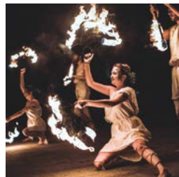
Kulturalny miesiąc strona 12-14