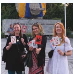
Urodziny nie na OPAK strona 28-29