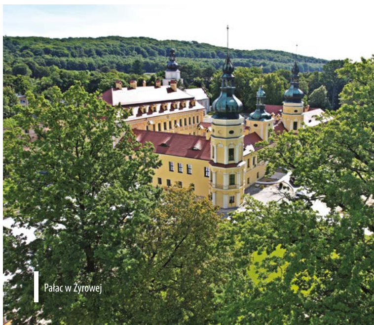
Pałac w Żyrowej