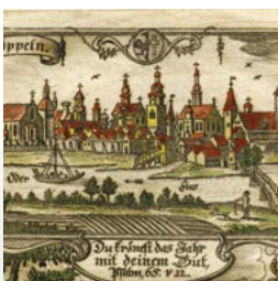
Miasto trzech „S” strona 26-27