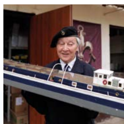
Każdy może pomóc ratować Barkę! strona 24-25