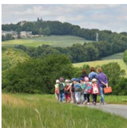
Podróże dalekie i bliskie – Góra Św. Anny strona 16-17