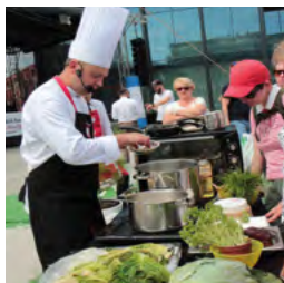
Kulinarne święto regionu strona 6-7