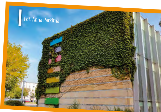
Fot. Anna Parkitna