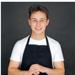
W kuchni lubię zaskakiwać strona 4-5