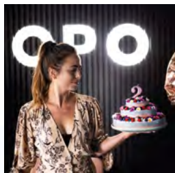
Kulturalna przestrzeń strona 20-21