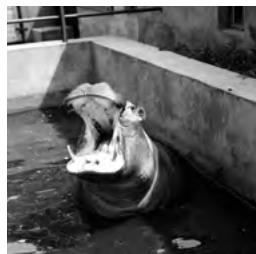
Opolskie ZOO ma już 70 lat strona 8-9