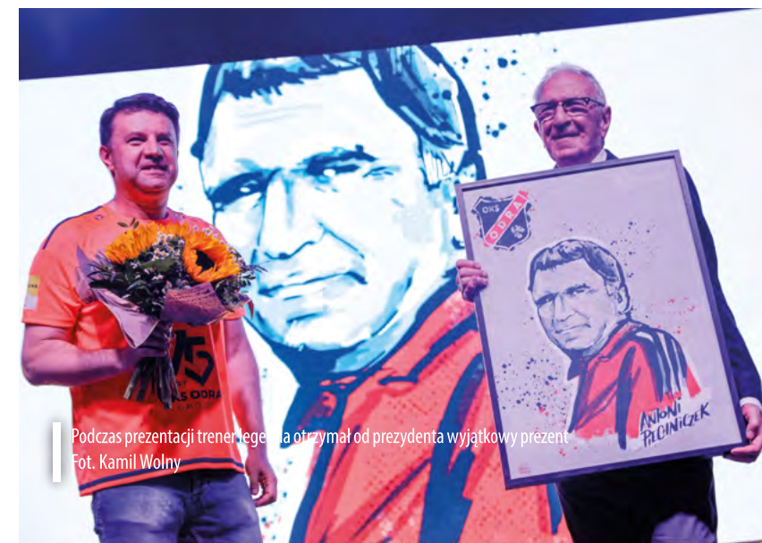
Podczas prezentacji trener legła otrzymał od prezydenta wyjątkowy prezent

Ubyli: Oskar Paprzycki (Chojniczanka Chojnice), Błażej Sapielak (Wieczysta Kraków), Maksymilian Pingot (Lech Poznań), Antoni Klimek (Widzew Łódź), Mikołaj Łabojko (Arka Gdynia), Bartosz Guzdek (Miedź Legnica), Michał Klec (Garbarnia Kraków) i Konrad Kostrzycki (szuka klubu).