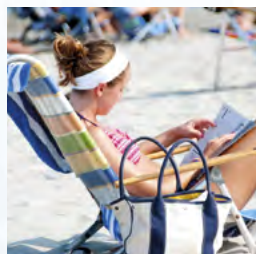
Opalajmy się, ale z rozsądkiem strona 32-33