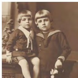
Śladami Jesionowskiego strona 14-15