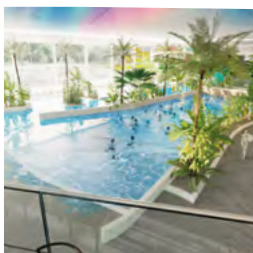
Wodne szaleństwo strona 12-13