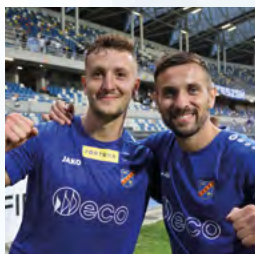
Odra Opole dobrze rozpoczęła nowy sezon strona 30-31