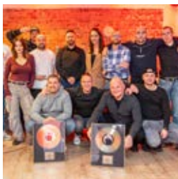
Z Opola na całą Polskę. 20 lat Step Records strona 7-9