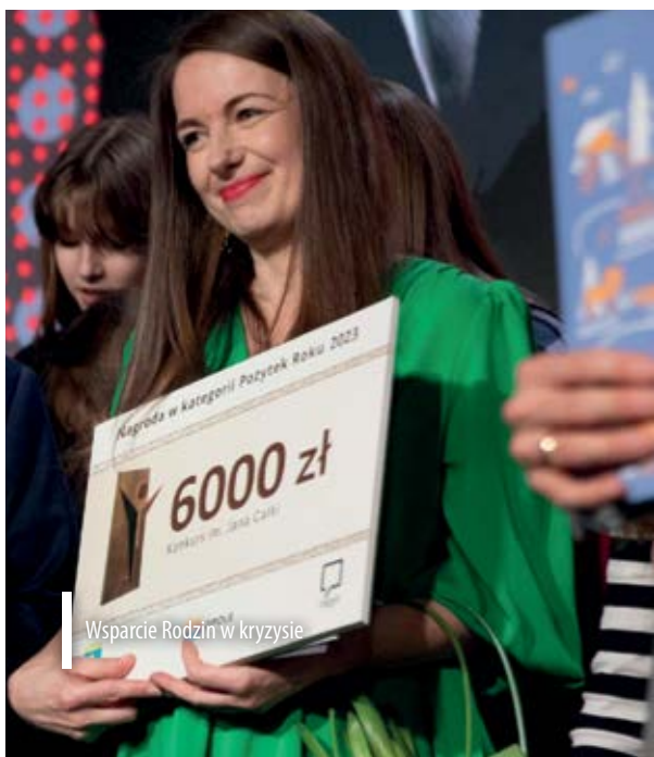
Wsparcie Rodzin w kryzysie