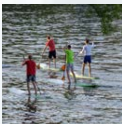
Dlaczego warto spróbować SUPa? strona 30-31