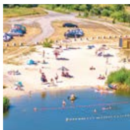
Bądźmy bezpieczni nad wodą strona 12-13