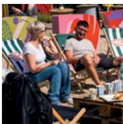
POP YARD. Nowe miejsce nad Odrą strona 18-19