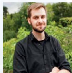
Przyjaciel na wagę złota strona 32-33