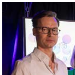
Stypendyści Stolicy Polskiej Piosenki strona 10-11