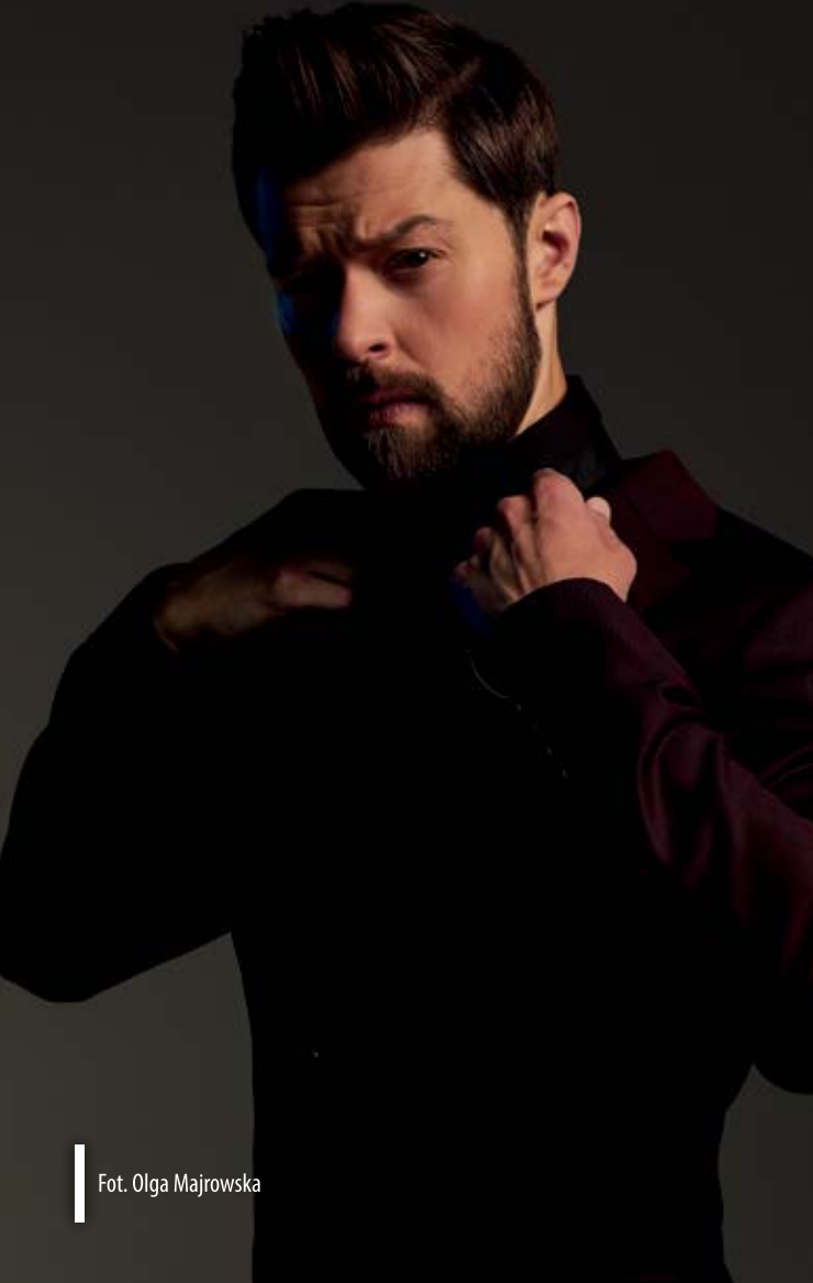
Fot. Olga Majrowska

botę, że zawitał do nas już chyba każdy. Od byłych prezydentów, przez twórców wszelkich gatunków literackich, celebrytów, aż po międzynarodowe sławy, jak na przykład B.A. Paris w tym roku. Wszyscy sprawiliśmy, że nie ma takiej osoby, która odmówiłaby Opolu.