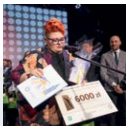
Tu najważniejsi są ludzie strona 24-25