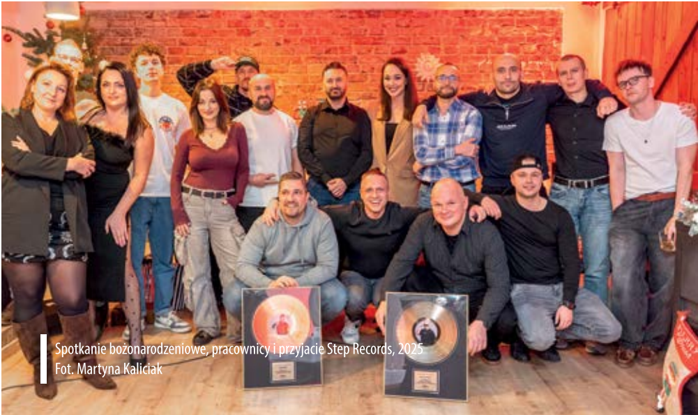
Spotkanie bożonarodzeniowe, pracownicy i przyjaciele Step Records, 2025

rą dwupłytowego albumu „Kwiaty zła” Piha – pierwszego wydawnictwa kompleksowo przygotowanego przez Step Records. Od tego momentu katalog zaczął dynamicznie się powiększać, a nazwa opolskiej wytwórni coraz częściej pojawiała się w rozmowach fanów hip-hopu w całej Polsce.