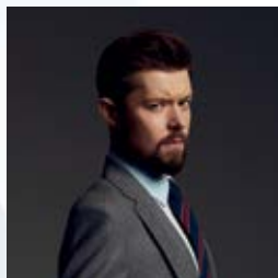
Opole wciąż mnie inspiruje strona 4-6