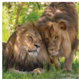
Opole na rodzinną majówkę? strona 12-13