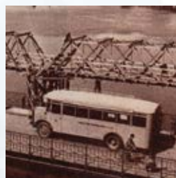
100 lat komunikacji miejsczej strona 30-32