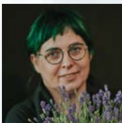
Balkon wiosną strona 26-28