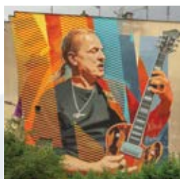
Sztuka i muzyka na żywo strona 24-25