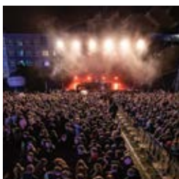
Piastonia od kuchni strona 17