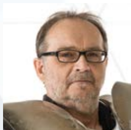
Pół wieku z niezwykłym artystą strona 4-6