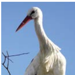
Pod skrzydłami bocianów strona 8-10