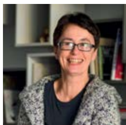
Sztuka mówi o rzeczywistości strona 14-16