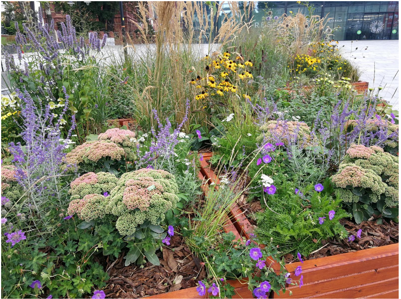
Mobilne łąki kwietne.