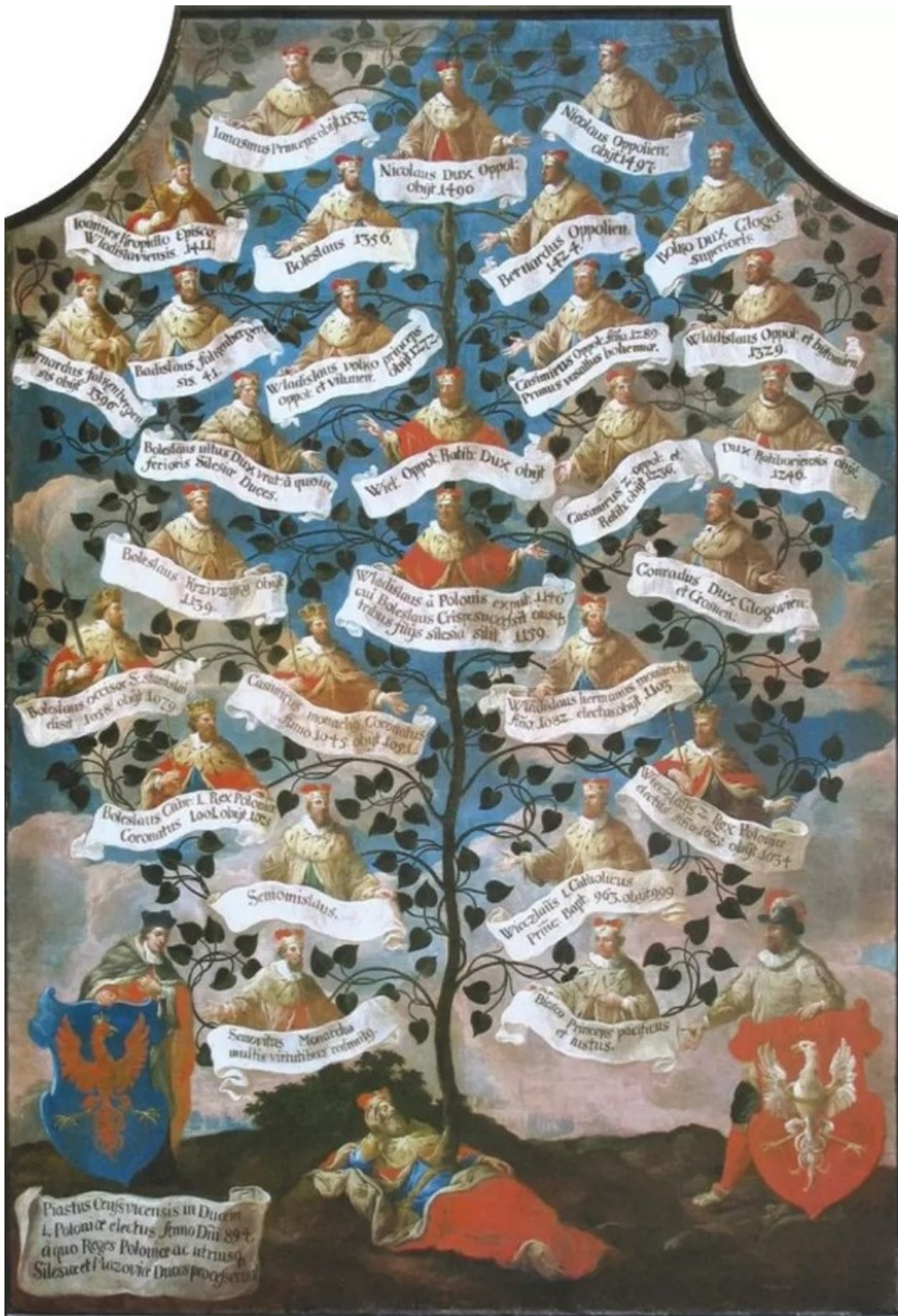
Drzewo Genealogiczne Piastów Opolskich ok. 1700 r. Katedra Świętego Krzyża w Opolu, Fot. K. Adamus