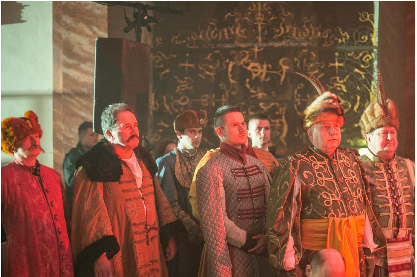
Inscenizacja z okazji 800 - lecia Opola, Fot. Sławomir Mielnik

Jego głos, tubalny i silny, odbijał się od kamiennych ścian, wywołując w zebranych dreszcz emocji. Szlachcianki spoglądały na królową, szukając w jej spojrzeniu choćby iskry zainteresowania i atencji. Magnaci trącali szabelki lub stukali obcasem, niecierpliwie czekając na słowa króla. Czy wiedzieli, że oto są świadkami historycznej chwili?