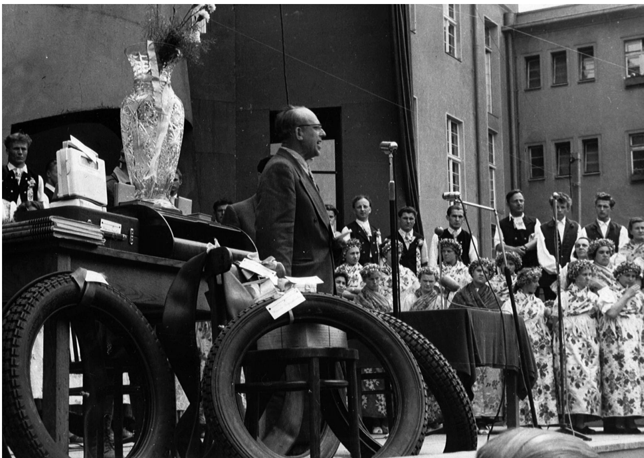
I Dni Opola, 1957 rok.