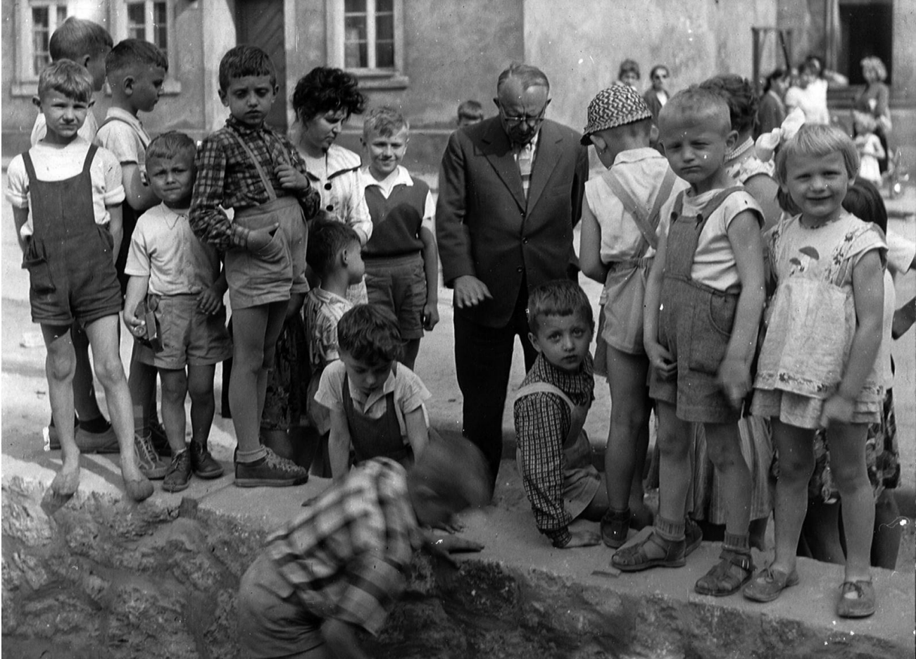
Narada z młodzieżą, 1956 rok.