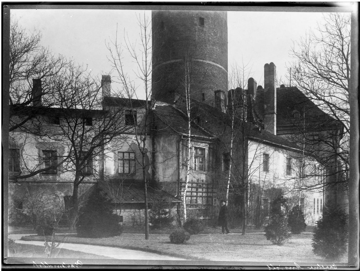
Zamek Piastowski w latach 20. XX wieku.