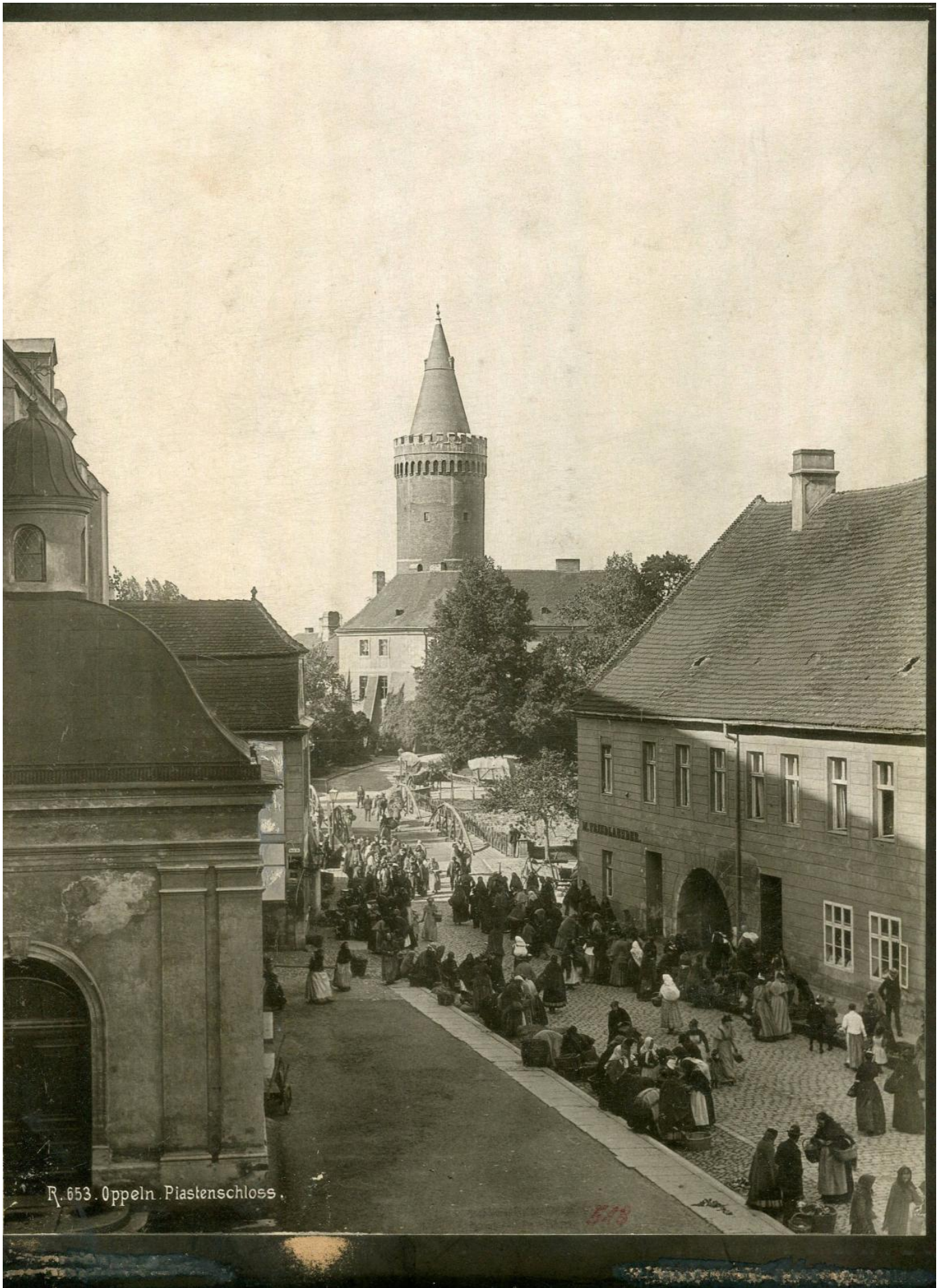
R. 653. Opatowitz. Piastenschloss.