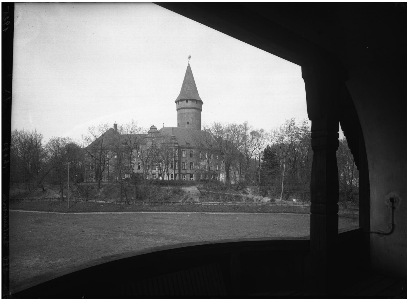
Widok od strony stawu zamkowego, lata 20. XX wieku.