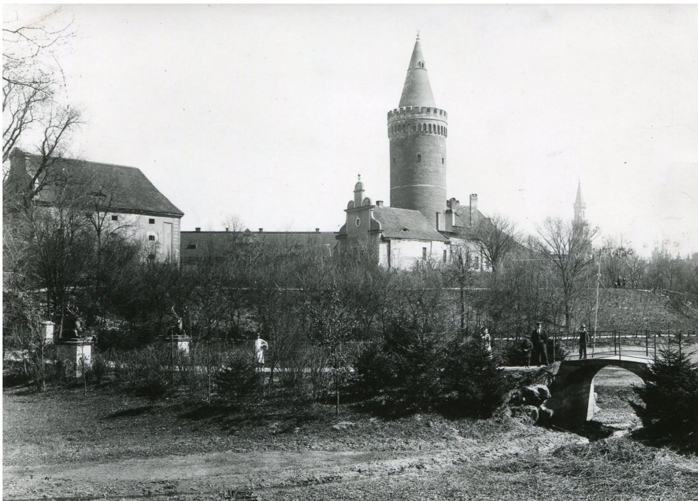
Zamek Piastowski i fragment parku zamkowego, widok od strony południowo-zachodniej, 1901 rok.