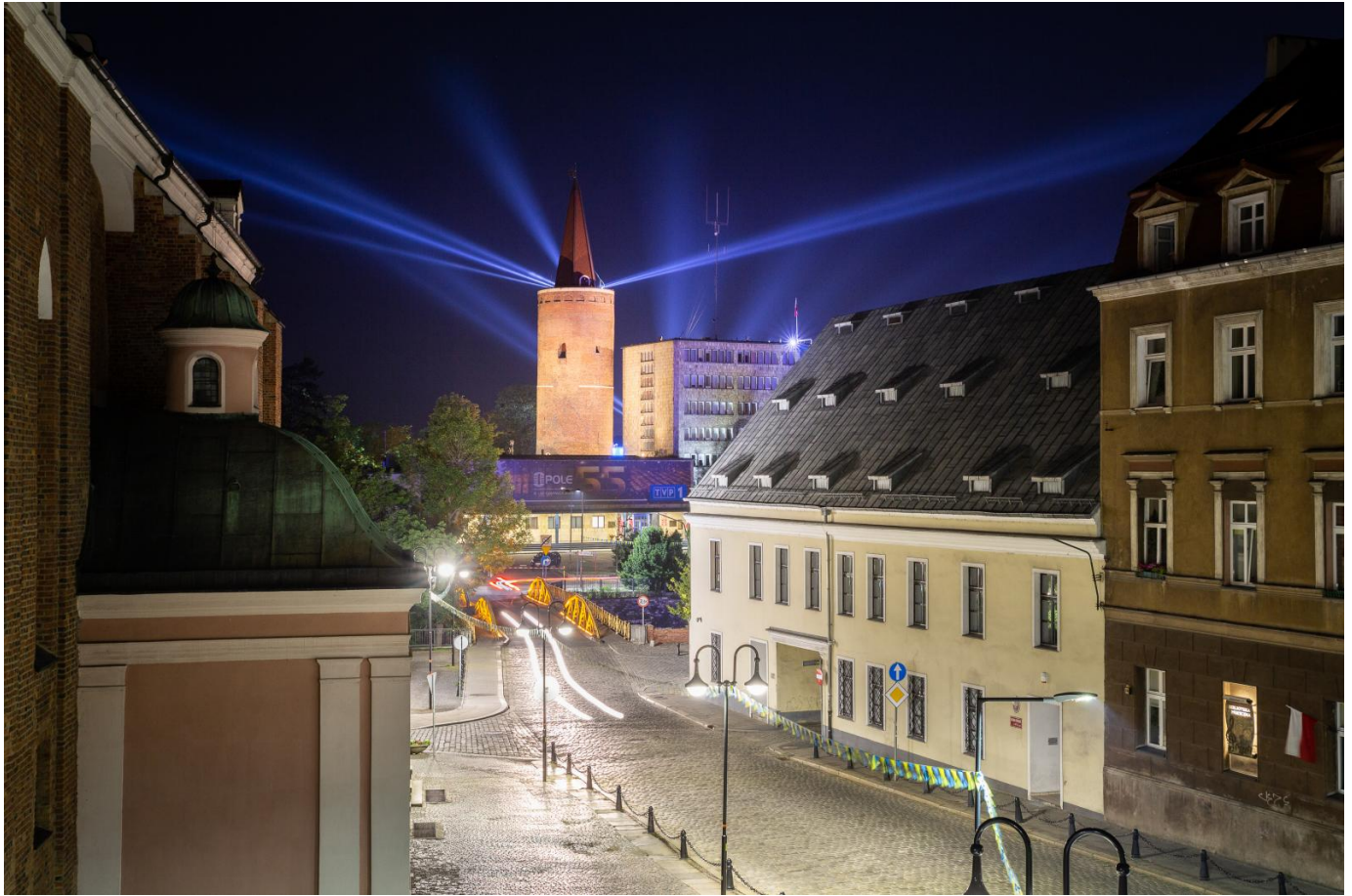
Wieża Piastowska obecnie