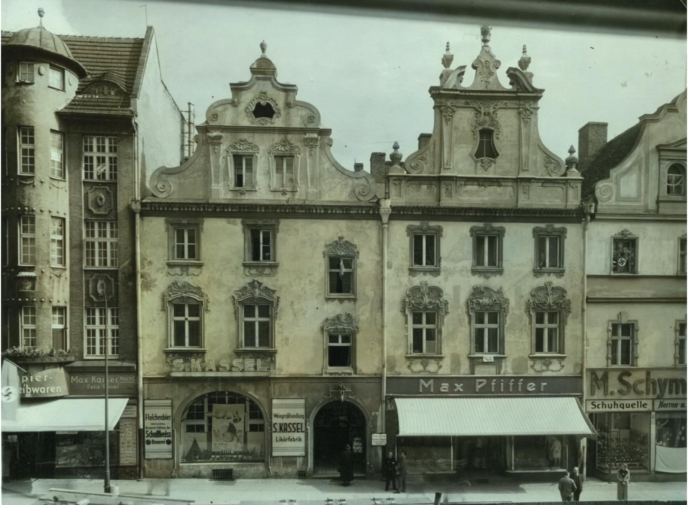
Południowa pierzeja rynku, lata 30. XX wieku