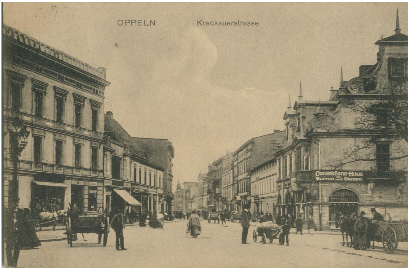
Zabudowa ulicy Krakowskiej, widok w stronę dworca, karta pocztowa, wyd. Rheinische Kunstverlagsanstalt, Wiesbaden, ok. 1909 r.