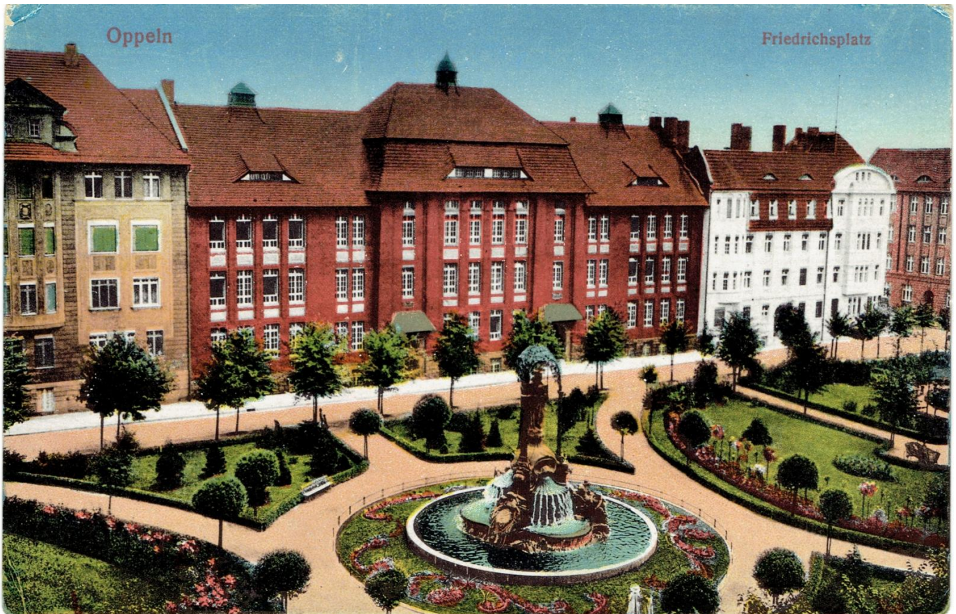
Plac I. Daszyńskiego, karta pocztowa, wyd. B. Scholz, Wrocław, ok. 1910 r.

Na szczycie fontanny, na kwiatowym impoście znajduje się postać kobieca z dzieckiem na ręku, bogini Ceres, przed wojną osłonięta ażurowym baldachimem. U jej stóp umieszczono postaci nawiązujące do głównych branż opolskiego przemysłu. Są tu dwie kobiety ze snopkami zboża i owocami, symbolizujące rolnictwo; mężczyzna z sieciami, symbolizujący rybołówstwo oraz górnik z kilofem, nawiązujący do przemysłu cementowego, którym Opole stało w XIX i XX w.