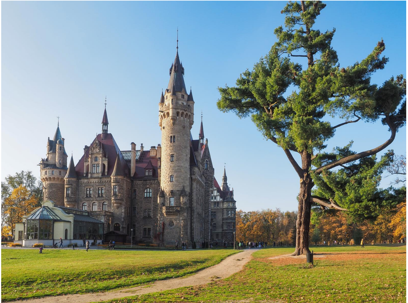
Pałac w Mosznej

bogactwo Von Thiele-Wincklerów jest efektem paktu z diabłem. Niezbitym dowodem na to miał być okazały pomnik diabła stojący przy zamku jeszcze do czasów II wojny światowej. Obecnie w pałacu znajduje się hotel i restauracja.