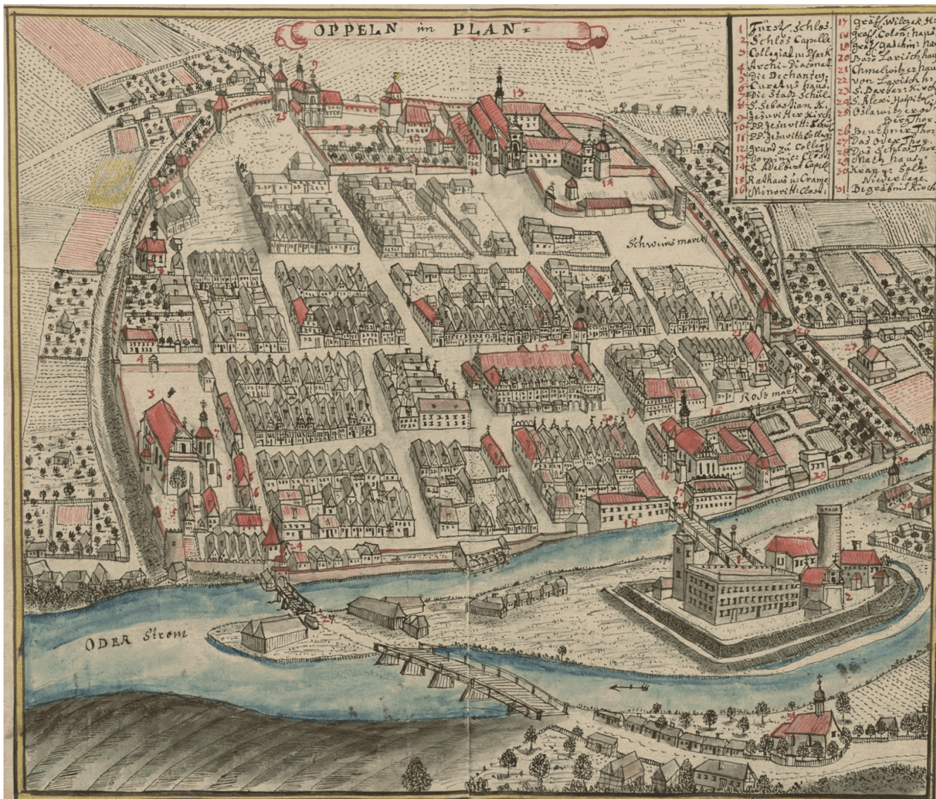
Rycina Opola z XVIII wieku autorstwa Friedricha Bernharda Wenera