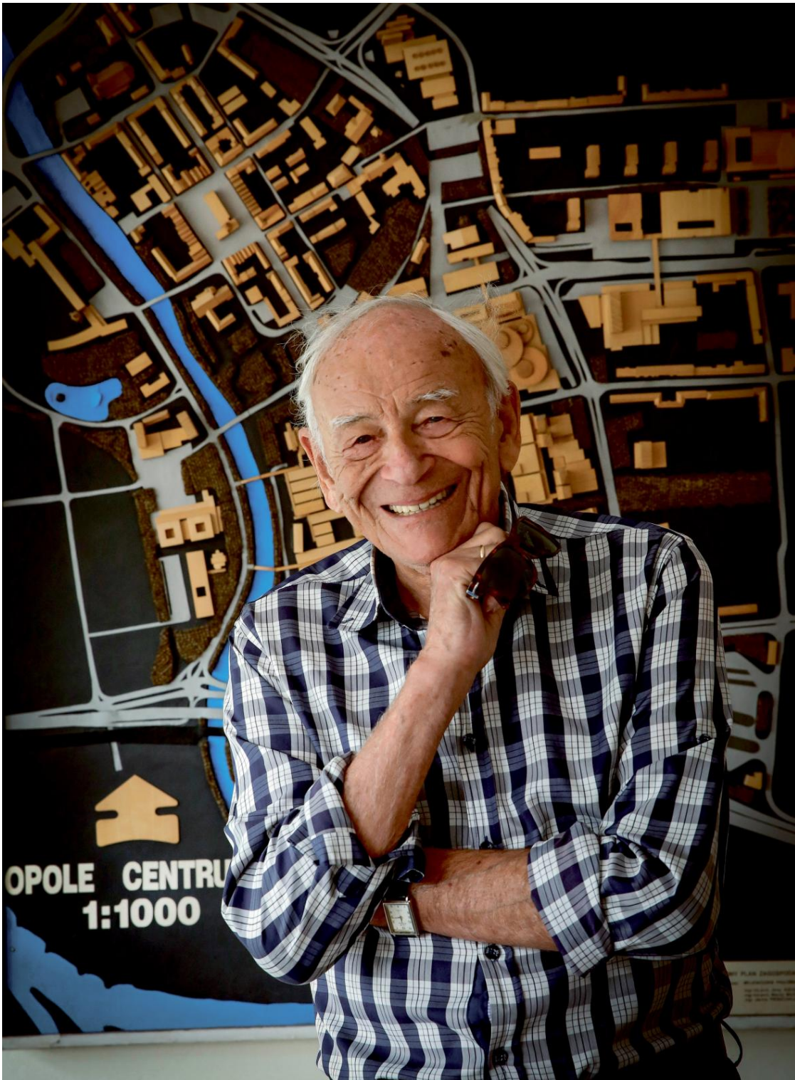
Andrzej Hamada

100 lat temu urodził się Andrzej Hamada – wybitny, opolski architekt i wizjoner.