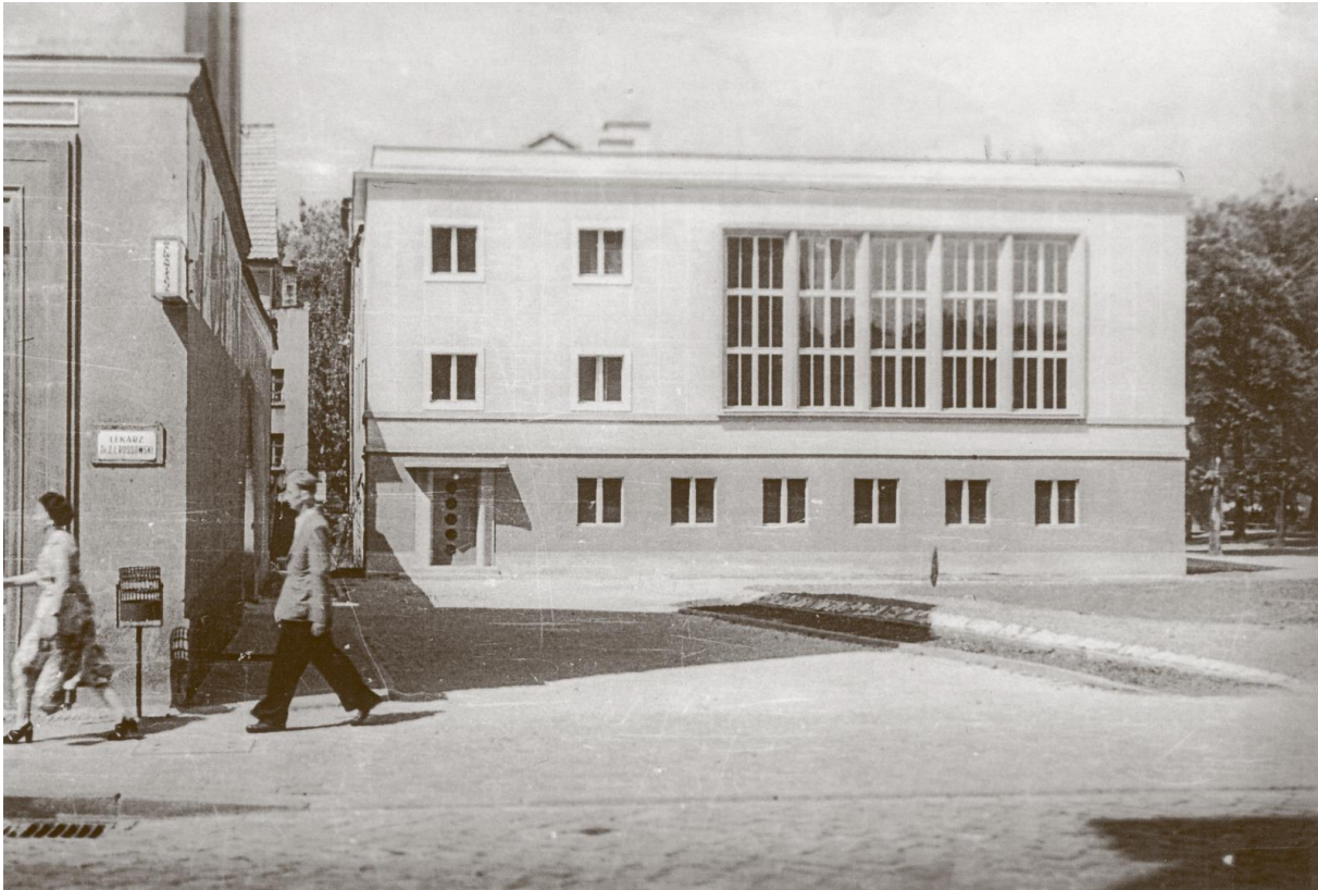
Opole, Teatr, 1955r. - projekt

Gdy przechodzi na emeryturę - ze szkicownikiem w ręku wędruje szlakiem zabytków, rysuje i opowiada... Stworzył ponad 200 rysunków, przedstawiających architekturę Opola i jej detale. Ponad 20 lat publikuje teksty i ilustracje na łamach pisma Uniwersytetu Opolskiego „Indeks”. Jest także autorem licznych publikacji poświęconych historii Opola, takich jak „Architektoniczne ABC Opola”, „Opole niegdyś i dzisiaj”, „Architektura Opola wpisana w dzieje miasta”.