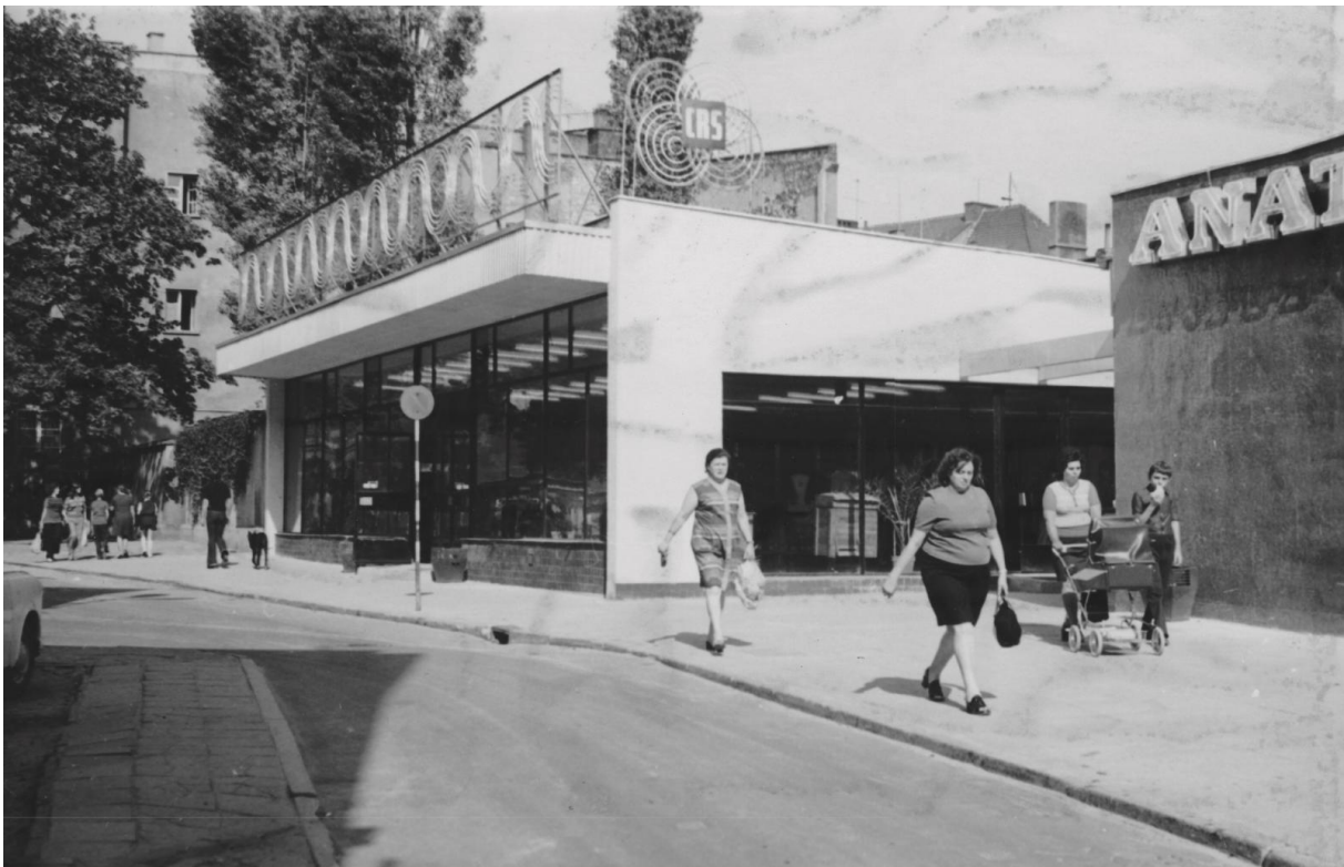
Opole, Anatol, 1972 r. - projekt

Wiele lat pełni funkcję Głównego Architekta Wojewódzkiego. Pracuje z sercem i pasją, początkowo przy odbudowie zrujnowanego Opolia, następnie przy tworzeniu jego nowego oblicza. Zafascynowany tysiącletnią przeszłością piastowskiego miasta odkrywa jego historyczne uroki. Wsłuchany w opowieści Szymona Koszyka, a później Fryderyka Kremsera o ziemi ojczystej, znajduje czas, poza absorbującą pracą zawodową, na studiowanie dostępnych archiwaliów. Fascynuje Go geneza kształtu przestrzennego miasta i jego architektura, od wczesnowiecznego grodu słowiańskiego na Ostrówku poprzez wielki gotyk i barok do współczesnych form modernizmu.