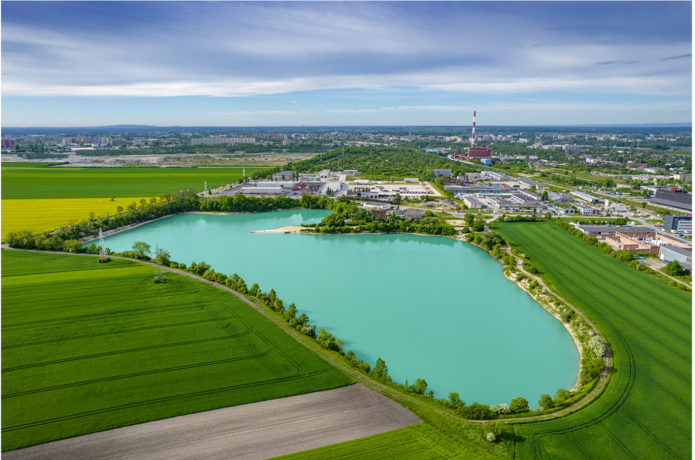
Kamionka Silesia i panorama