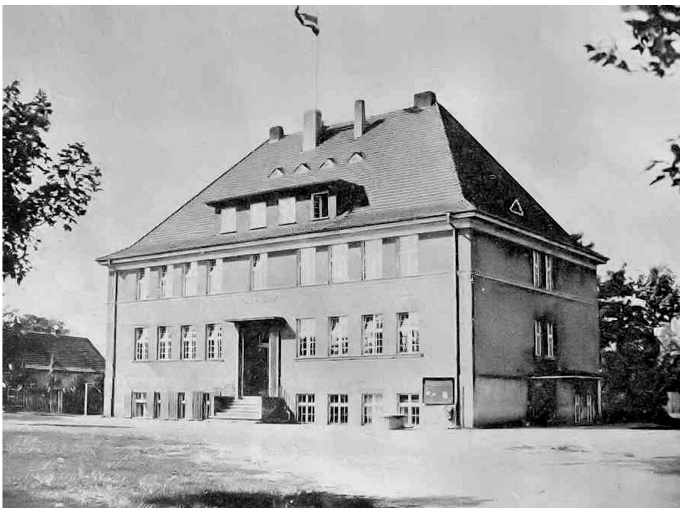
Szkoła w roku 1936