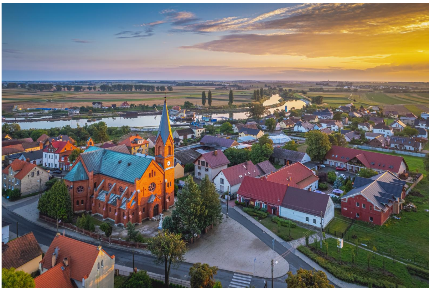
Panorama Groszowic z lotu ptaka. Fot. Grzegorz Naszkiewicz

Zdjęcia pochodzą z książki J. Kowohla z 1936 roku „700 Jahre industriell - ländlicher Gemeinde Groschowitz”