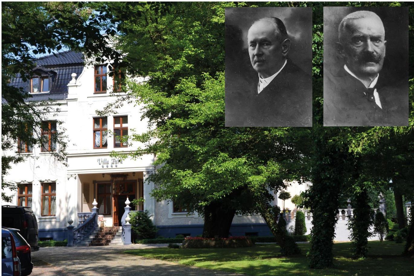
Rezydencja Villa Park w Groszowicach