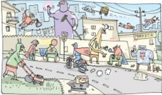
OPOLE - MIASTO SUPERBOHATERÓW