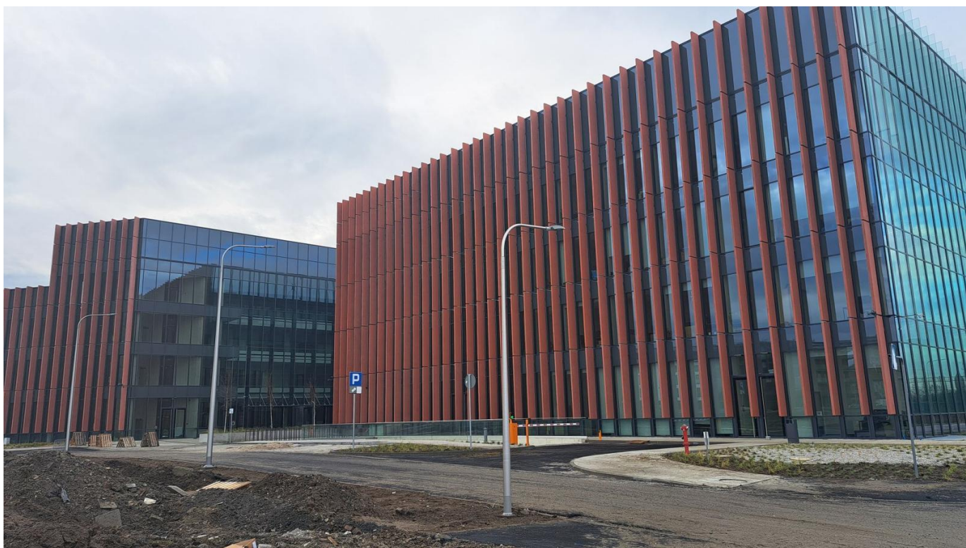
Centrum Usług Publicznych w Opolu

9. Wodna Nuta - Otwarta w 2013 roku pływalnia z torami o długości 50 metrów była jednym z niewielu takich obiektów w Polsce. Historia tego basenu zaczęła się już w latach 90., gdy wtedy mówiono o wybudowaniu takiego obiektu, wydawało się to odległym marzeniem. A jednak zostało zrealizowane z korzyścią dla mieszkańców. Świadczy o tym fakt, że w weekendu trudno czasem jest znaleźć miejsce na wielkim parkingu przy pływalni.