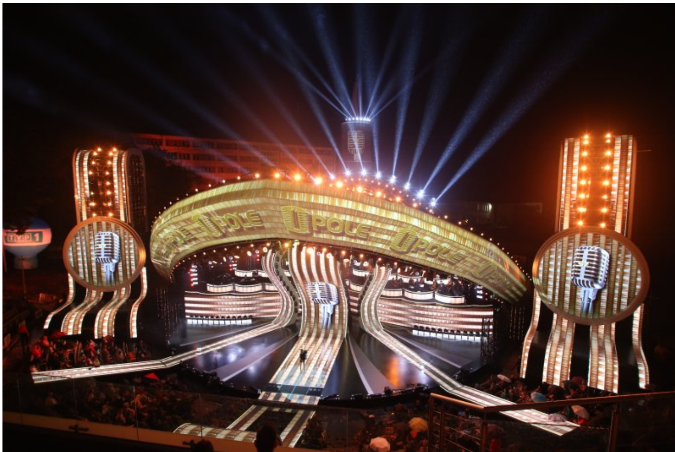
57. KFPP w Opolu, 2020 r.