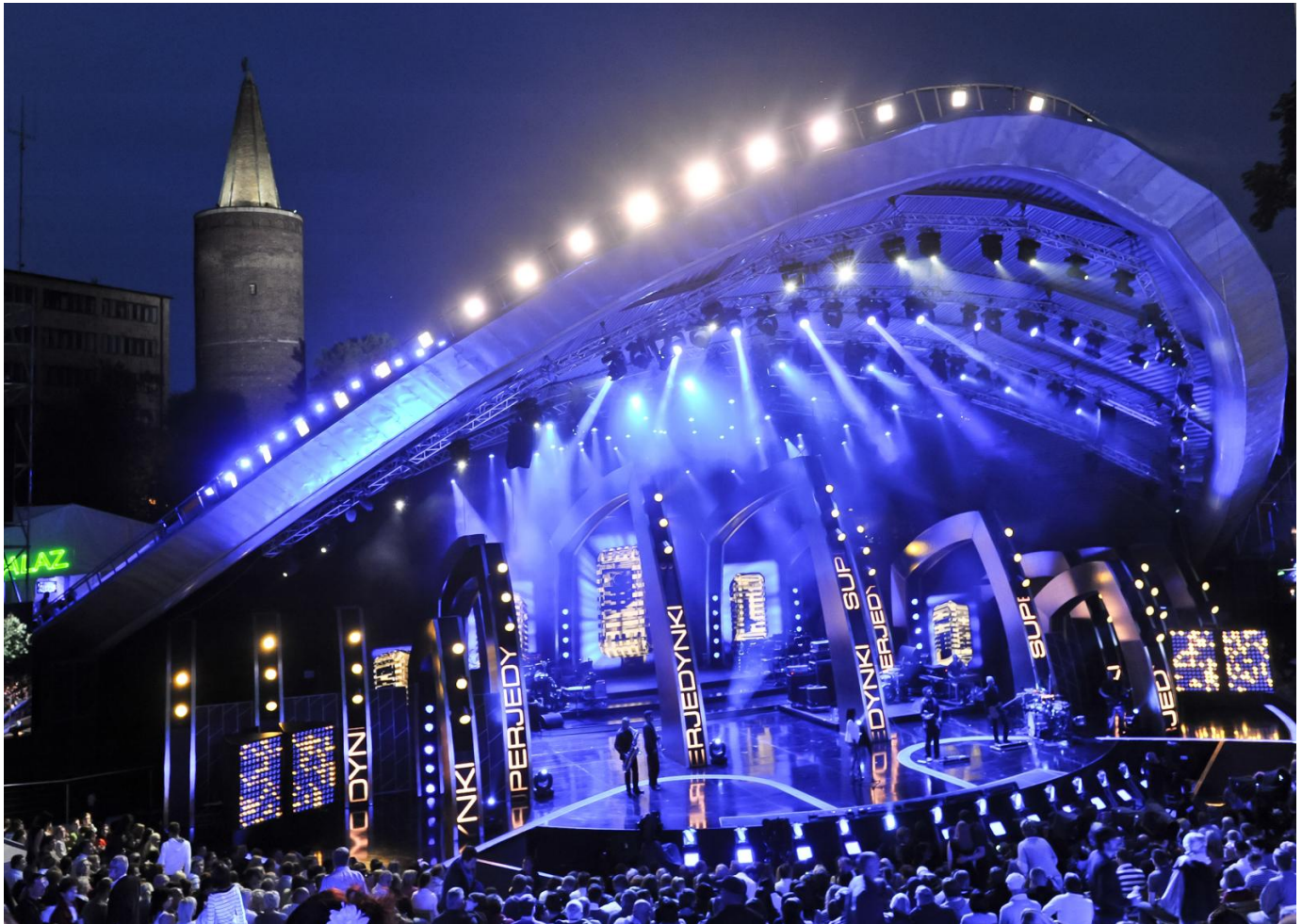
48. KFPP w Opolu, 2011 r.