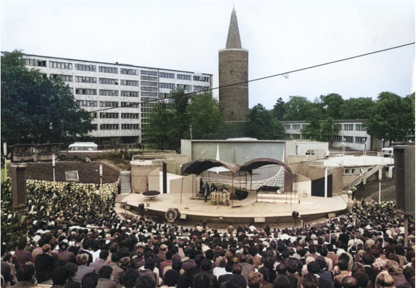
Amfiteatr w trakcie I KFPP, fot. Marek Karewicz, zdjęcie koloryzowane.

miałem być tylko przez trzy miesiące. Na początku zaprojektowałem przystanek na pl. Wolności i fontannę. Dopadł mnie papa Musioł i tak zostałem. Potem przyszła kolej na większe projekty, bez których dziś trudno byłoby sobie wyobrazić Opole.