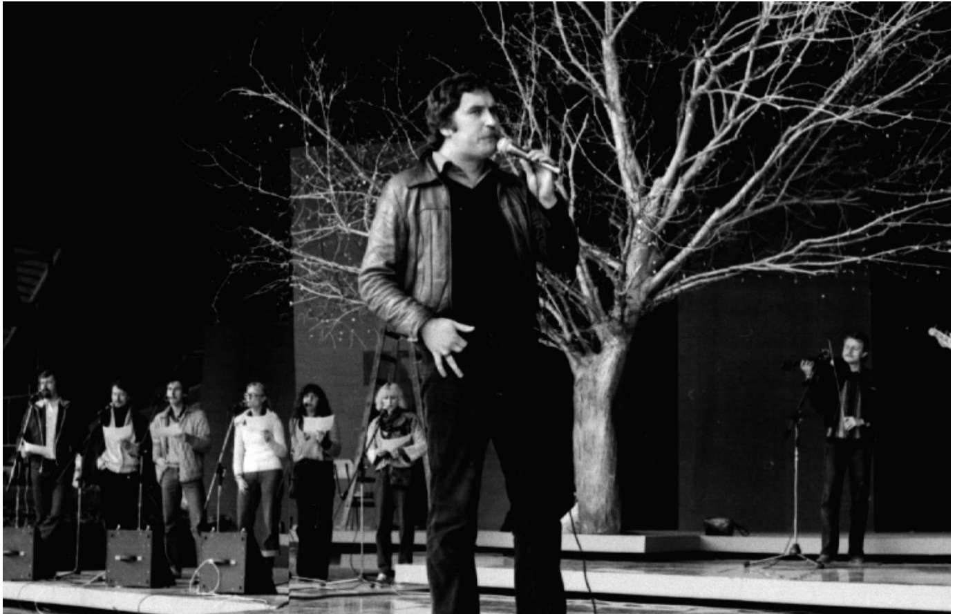
XIX KFPP w Opolu, 1981 r.

nadziei – jego projekt przewidywał umiejscowienie na scenie jedynie wielkiego drzewa. Jak wspominał artysta: Moje drzewo nadziei! To była dekoracja, która zrodziła się w ciągu sekundy. Jeszcze chciałem bawić się w żarówki i neony, aż któregoś wieczoru wpadł mi do głowy pomysł, żeby zrobić drzewo nadziei! Szczęśliwy jestem, że ja przy tym drzewie też ze wzruszenia płakałem.