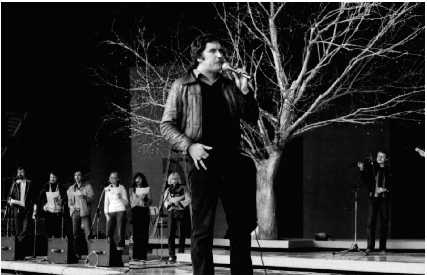
XIX KFPP w Opolu, 1981 r.