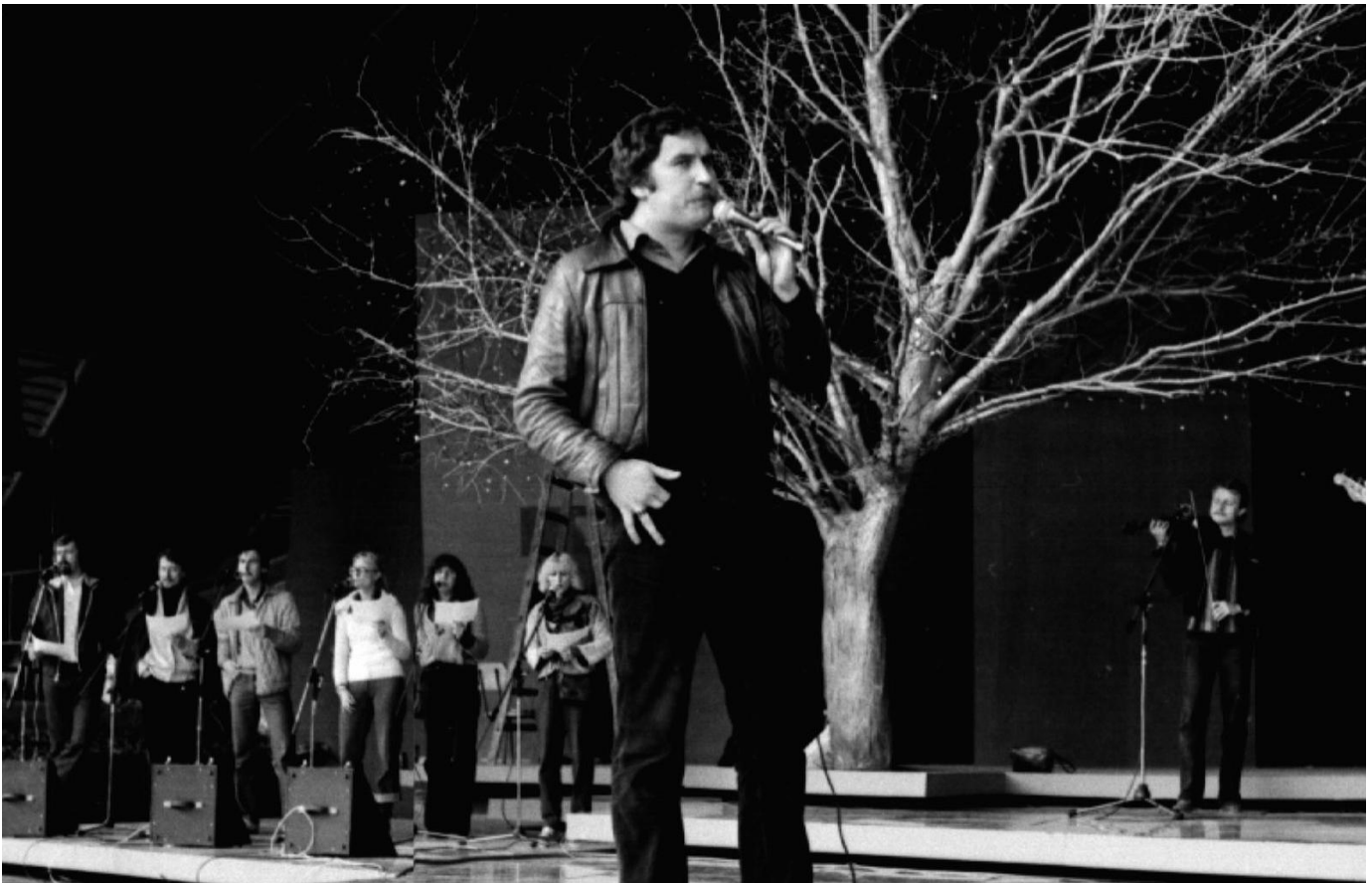
XIX KFPP w Opolu, 1981 r.