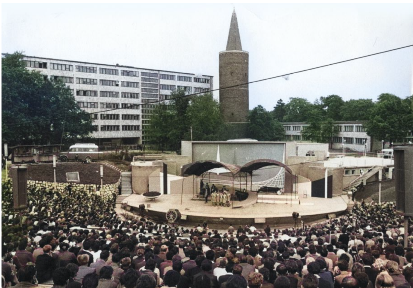
Amfiteatr w trakcie I KFPP, zdjęcie koloryzowane.