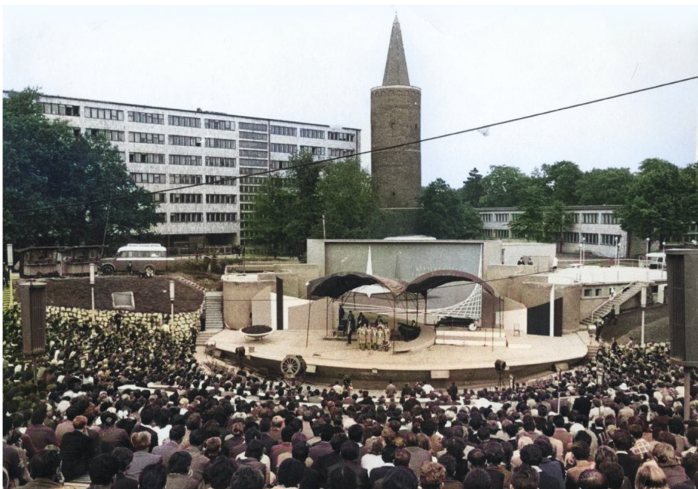
Amfiteatr w trakcie I KFPP, zdjęcie koloryzowane.