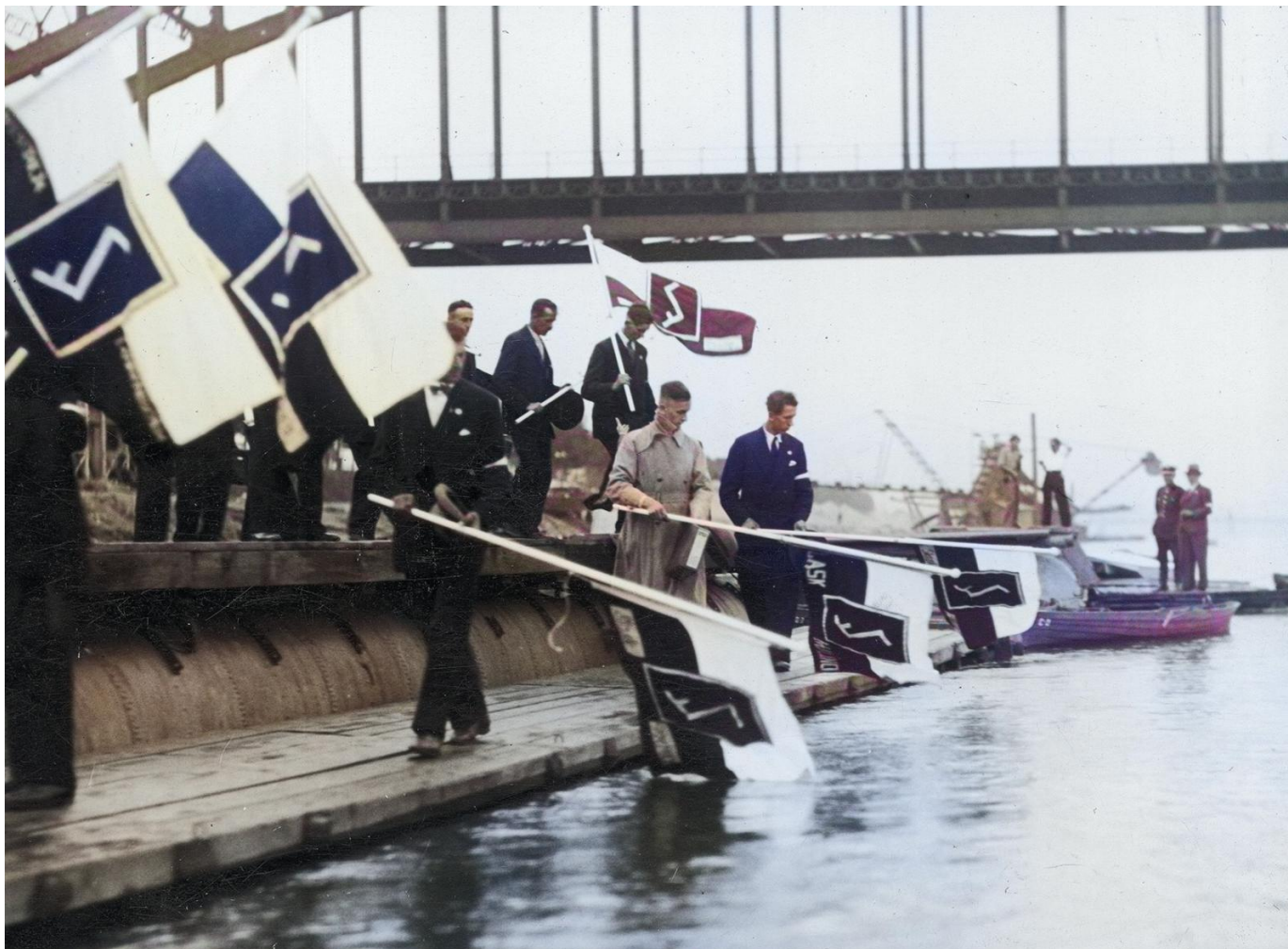
II Światowy Zjazd Polaków z Zagranicy w Warszawie. Uczestnicy zjazdu podczas uroczystości w Stołecznym Oficerskim Yacht-Klubie RP. Widoczni mężczyźni trzymający sztandary ze znakiem Rodła, 5-12.08.1934 r.; zdjęcie koloryzowane