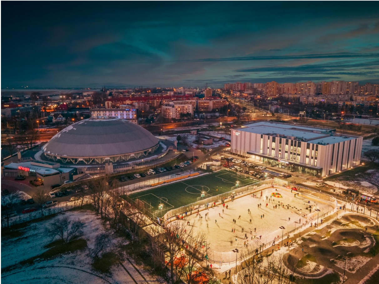
Stegu Arena oraz Toyota Park.

powiatu (prawie 13%). Autorzy rankingu zwracają uwagę na jeszcze jedną bardzo wyraźną zmianę, jaka zachodzi od kilku lat w finansowaniu inwestycji samorządowych. „To rosnące uzależnienie od krajowych dotacji.” Znacznie pogorszyły się możliwości samodzielnego prowadzenia projektów inwestycyjnych, a to za sprawą m.in. zmian w systemie podatkowym.