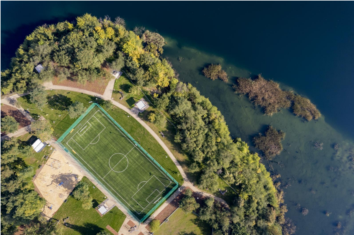
Rewitalizacja Kamionki Piast

W rankingu miast wojewódzkich Opole dość wyraźnie wyprzedza Szczecin i Poznań (wydatki liczone są per capita, czyli „na głowę mieszkańca”). Warszawa jest dopiero 9. a Wrocław 11. Wśród małych miast lideruje Uniejów (woj. łódzkie), a wśród powiatowych pierwszym i drugim miejscem zamieniły się Poddębice (również woj. łódzkie) i Polkowice (woj. dolnośląskie). Wśród powiatów wygrał wysokomazowiecki (woj. podlaskie). Autorzy rankingu brali pod uwagę całość wydatków majątkowych poniesionych w ciągu ostatnich trzech lat (w tym przypadku 2019-2021). W ten sposób chcieli uniknąć dużych, chwilowych wahań wskaźnika będącego podstawą rankingu.