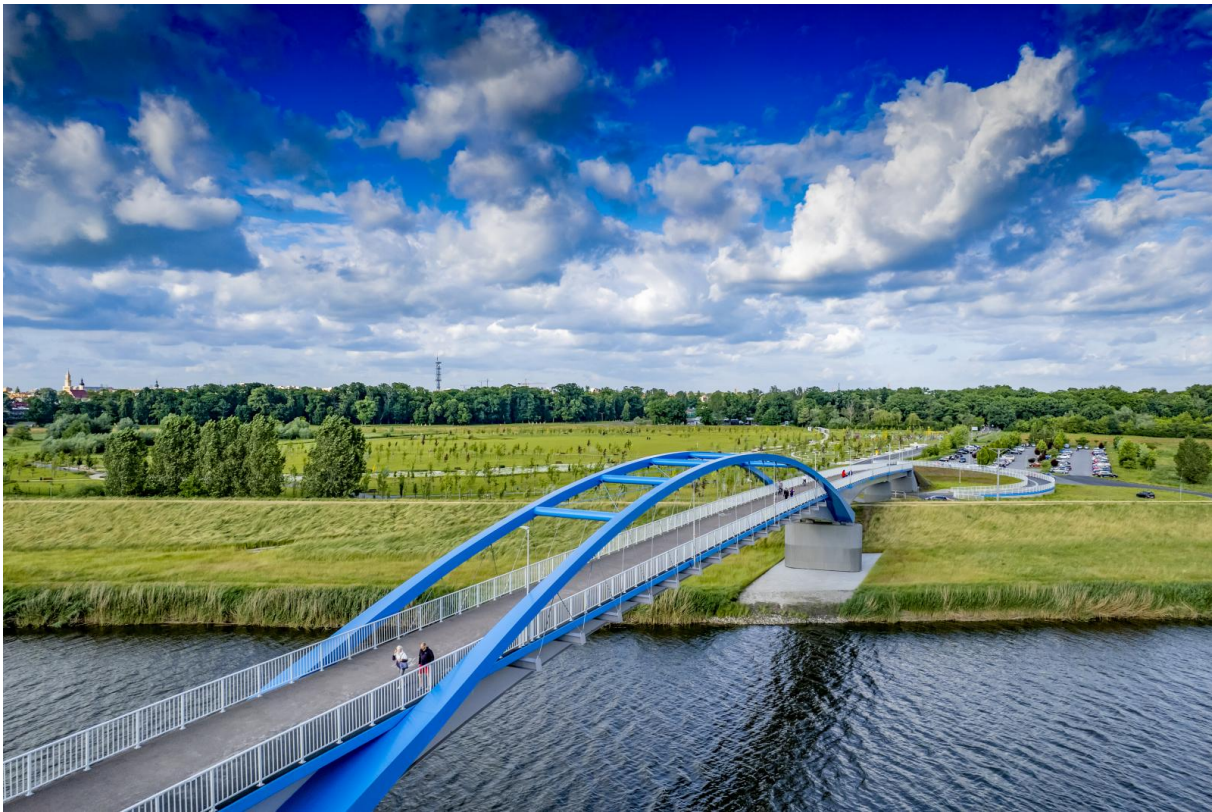
Most pieszo-rowerowy na Wyspę Bolko

- Inwestycje to proces wieloletni. Przygotowanie niektórych zajmuje nawet kilka lat, choć proces budowy można zamknąć w półtora roku i krócej. Dodatkowym wyzwaniem jest też montaż finansowy, a ogromnym nadzór nad prowadzoną inwestycją. W Opolu inwestycje wyraźnie przyspieszyły od 2017 r. Część inwestycji to umowy wieloletnie, nie można ich było po prostu przerwać bo był covid. Wykonawcy też dali radę i choć czas realizacji niektórych inwestycji się wydłużył, to udało się je doprowadzić do końca. Może z niewielkimi modyfikacjami kosztorysów – mówi prezydent.