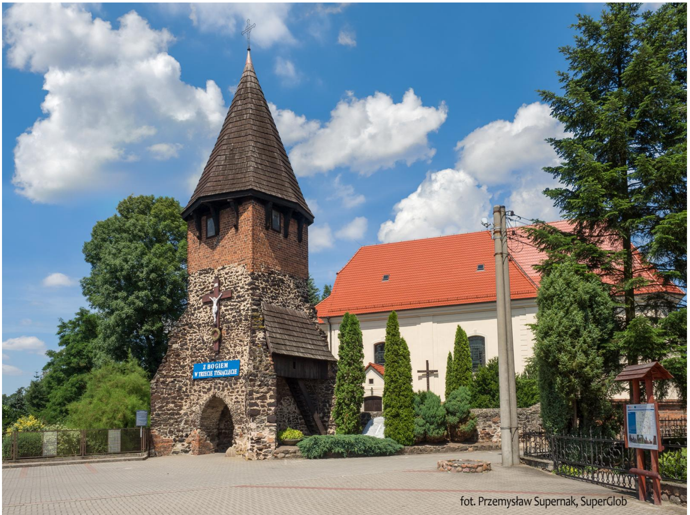
Chróstina Opolska, gotycka dzwonnica

przejeżdżając przez przejazd kolejowy. Dwieście metrów dalej zjeżdżamy z głównej drogi w prawo, w ul. Kościelną , którą dojeżdżamy do zabytkowego Kościoła św. Apostoła Piotra i Pawła. Tuż przy nim znajduje się jeden z bardziej malowniczych zabytków Opolszczyzny – gotycka dzwonnica z XV wieku , przypominająca piastowską historię ziem, które później, przez kilkaset lat znajdowały się poza terytorium Polski. To najstarsza zachowana pamiątka długiej historii wioski, o której pierwsze wzmianki pochodzą aż z 1223 roku. Pierwszy kościół powstał tu najprawdopodobniej w XIV w., ale nie zachował się po nim żaden ślad, oprócz zbudowanej później dzwonnicy.