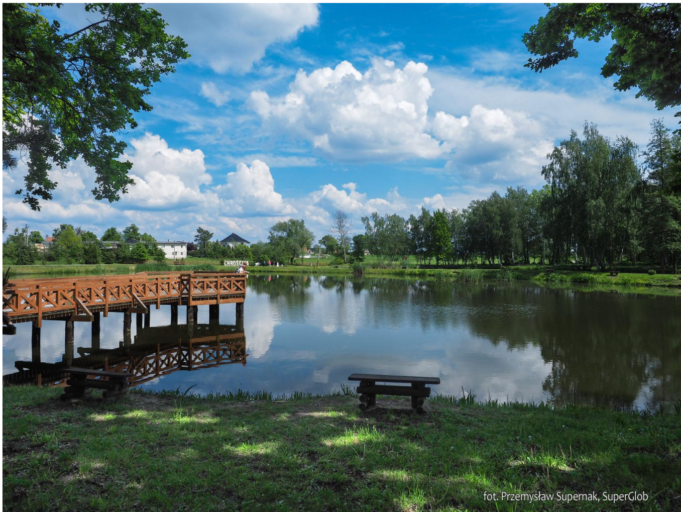
Park w Chróscinie Opolskiej