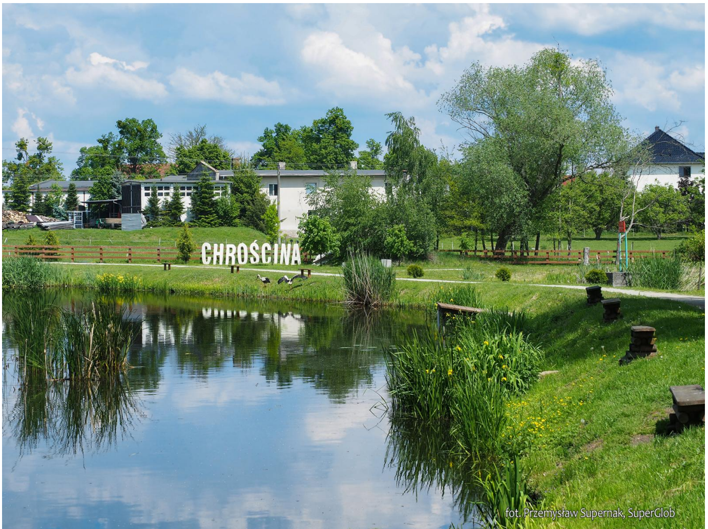
Park w Chróścinie Opolskiej

Za kościołem skręcamy w prawo, w ul. Niemodlińską. Dwieście metrów, tuż przy charakterystycznym dworku, w którym mieści się Zespół Szkół możemy zjechać w lewo, do kameralnego parku . To doskonałe miejsce na krótki postój lub dłuższy piknik. W parku znajdują się dwa zarybione stawki. Na jednym z nich zbudowano niewielkie moło. Tuż obok, pośród drzew, powstało „plenerowe spa”, z miejscem, gdzie możemy zanurzyć nogi w orzeźwiającej wodzie. Są tu też ławki ze stolikami, miejsca na ognisko oraz plenerowa siłownia. Tutejsze łąki, szczególnie pięknie wyglądają na wiosnę, kiedy kwitną polne kwiaty oraz krzewy rododendronów.