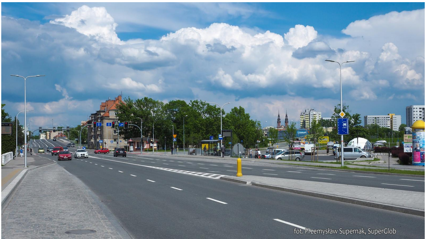
Opole, ul. Niemodlińska w dzielnicy Zaodrze

Startujemy z ronda przy ul. Książąt Opolskich i Nysy Łużyckiej . Kierujemy się za zachód, jadąc ciągiem pieszo-rowerowym po prawej stronie ulicy. Przejeżdżając przez most na Odrze, warto zwrócić uwagę na widok po lewej stronie – to chyba najładniejsza panorama Starego Miasta . Gdy za mostem przejedziemy przez skrzyżowanie ze światłami, od razu za nim skręcamy w prawo i potem w lewo, okrążając niewielki skwer i wjeżdżając na nowo wybudowaną drogę rowerową. Chwilę później przejeżdżamy przez most na Kanale Ulgi i wjeżdżamy do dzielnicy Zaodrze. Jedziemy cały czas prosto, ul. Niemodlińską . Na trzecim skrzyżowaniu ze światłami, licząc od kanału, przejeżdżamy na drugą stronę ulicy, by po kilkuset metrach, przy stacji benzynowej, wrócić z powrotem na lewą stronę. Wygodną drogą rowerową wyjeżdżamy z miasta.