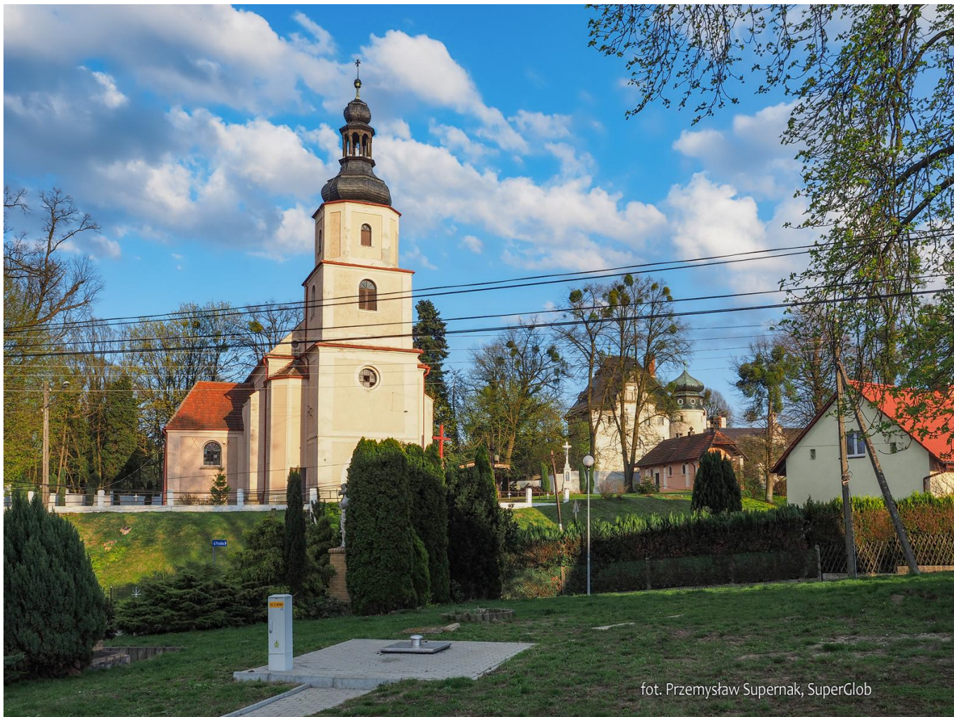
Kościół św. Wawrzyńca w Dąbrowie Niemodlińskiej