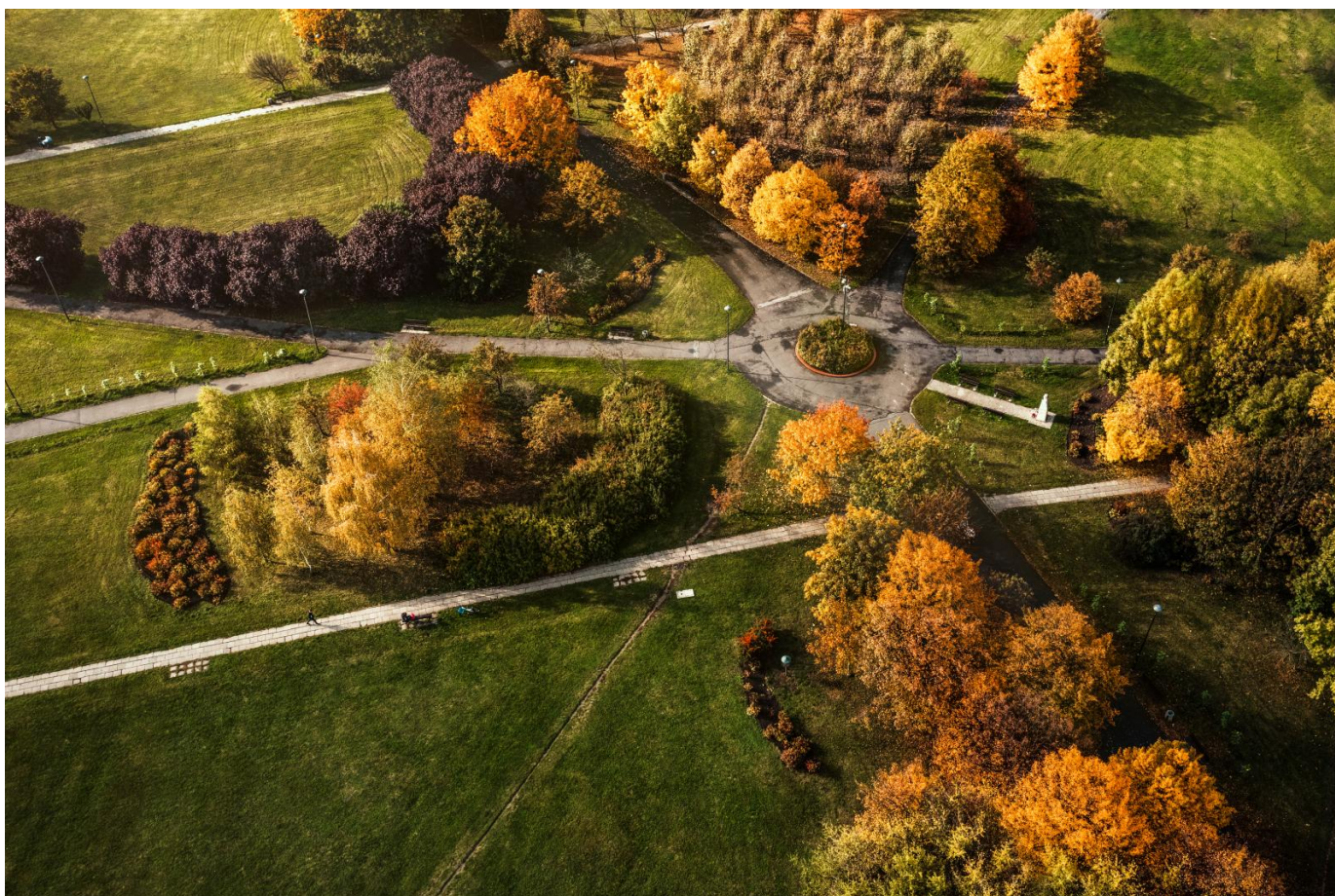
Fot. Adam Wójcik, II miejsce