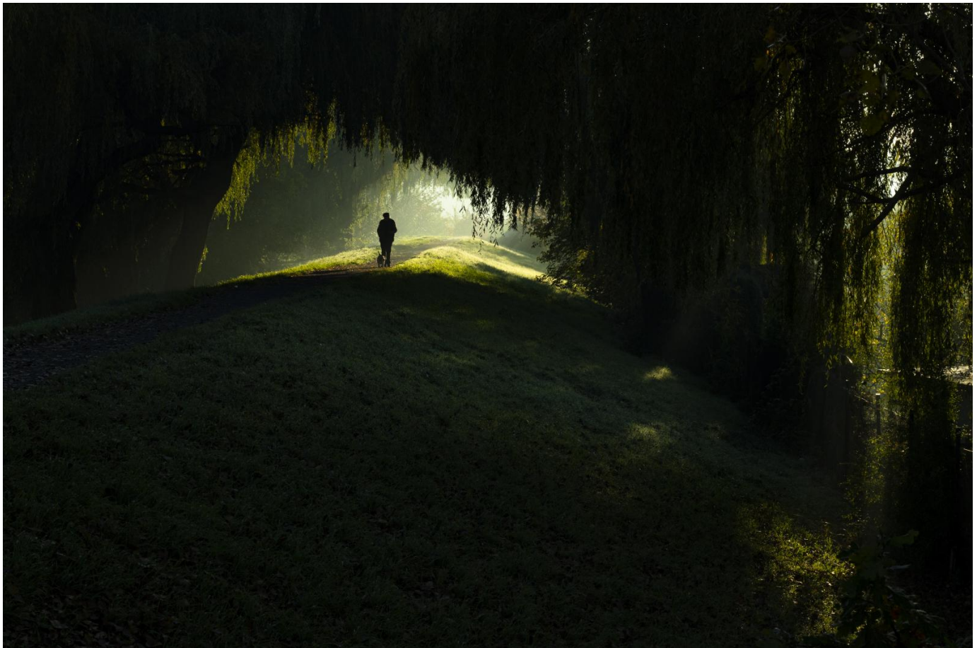
Fot. Małgorzata Wolak, I miejsce

Pierwsze miejsce i nagrodę 1000 zł otrzymała Małgorzata Wolak za klimatyczne zdjęcie bulwarów nad Odrą, drugie z nagrodą 500 zł - Adam Wójcik za fotografię parku na osiedlu im. Armii Krajowej z lotu ptaka, a trzecią nagrodę w wysokości 300 zł otrzymał Arkadiusz Michalik za oryginalne ujęcie Teatru im. Jana Kochanowskiego.