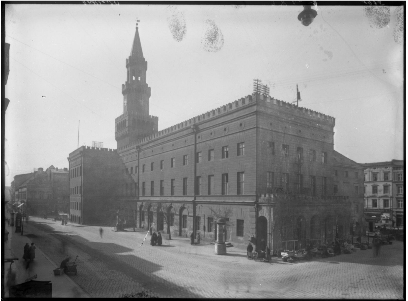
Widok od strony północno-wschodniej, ok. 1916 r.