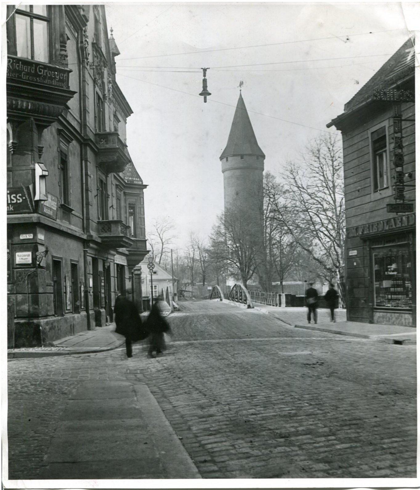
Ulica Zamkowa po rozbiórce Zamku Piastowskiego, ok. 1930 rok.