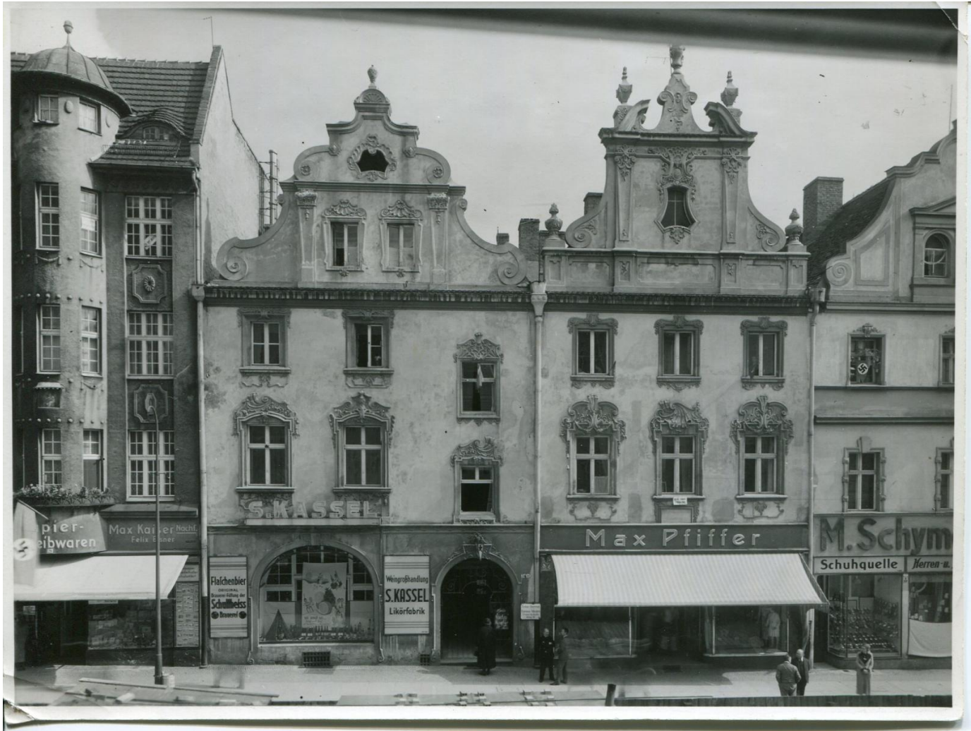
Południowa pierzeja rynku, lata 30. XX wieku