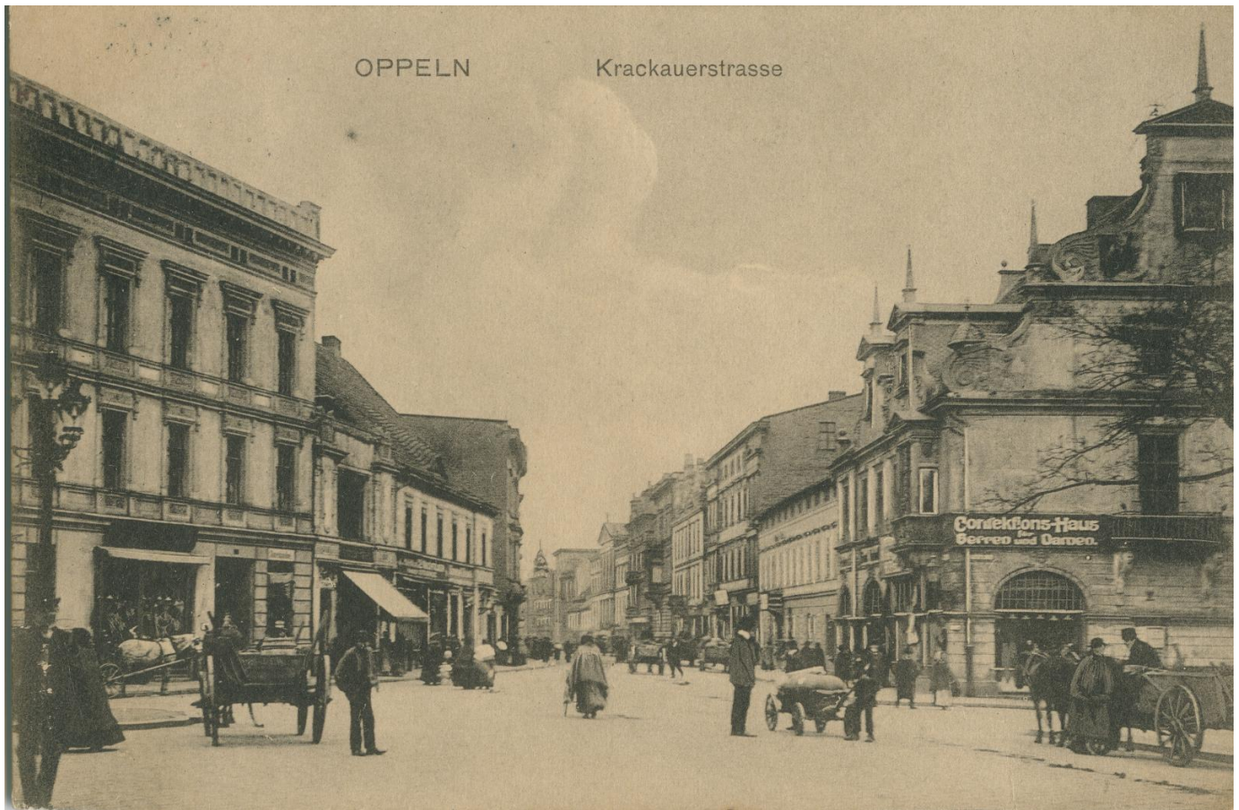
Zabudowa ulicy Krakowskiej, widok w stronę dworca, karta pocztowa, wyd. Rheinische Kunstverlagsanstalt, Wiesbaden, ok. 1909 r.