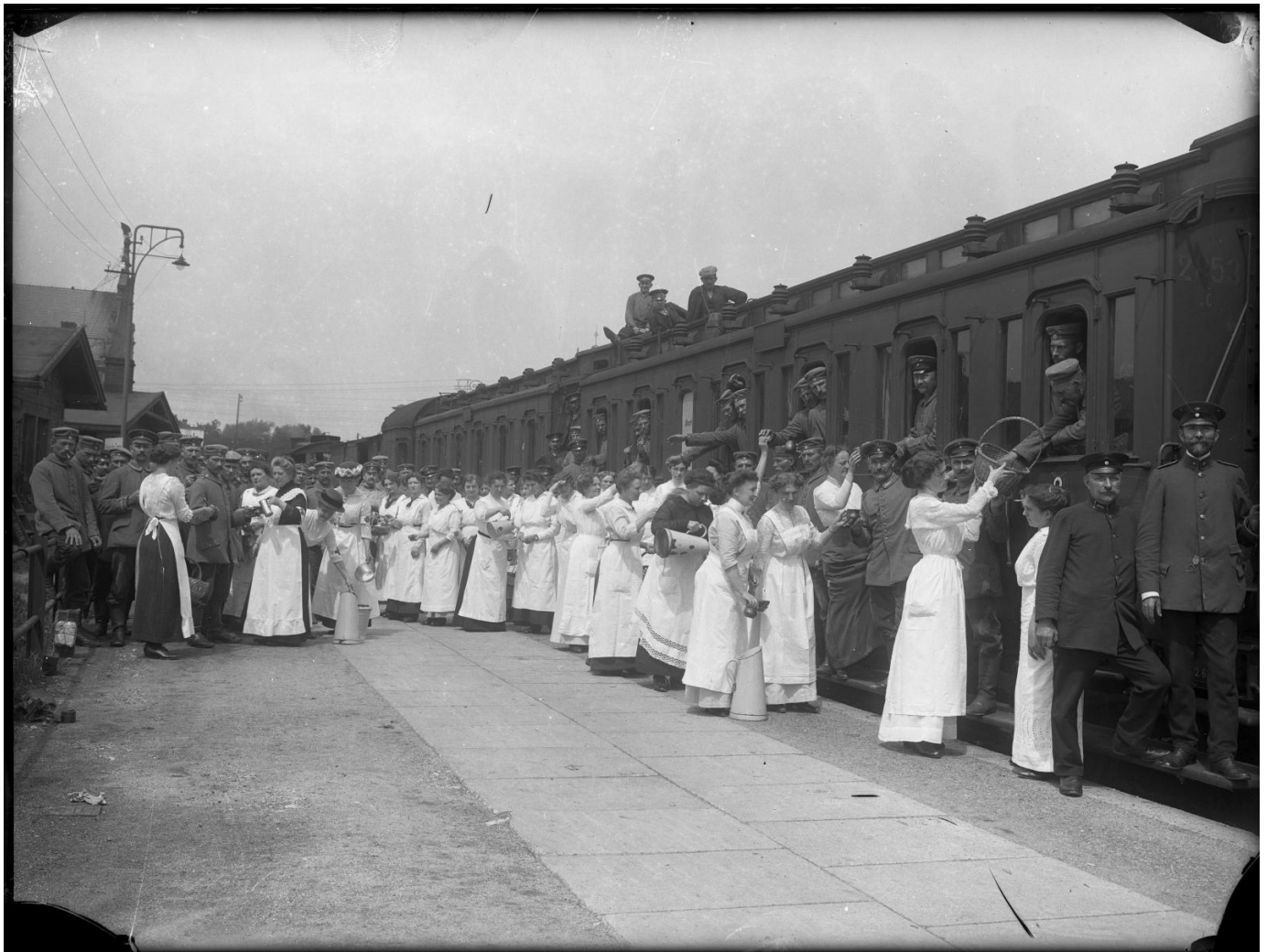
Peron dworca w czasie I wojny światowej. Kobiety z Czerwonego Krzyża rozdają żywność, około 1915 roku.