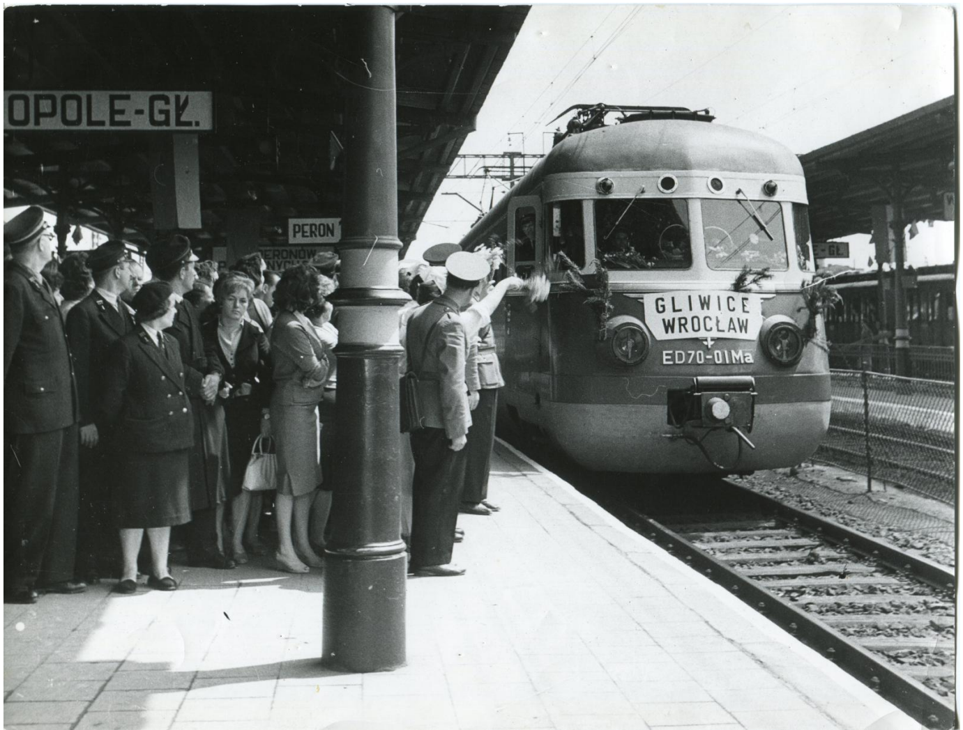
Peron dworca w latach 60. XX wieku, fot. R. Okoński