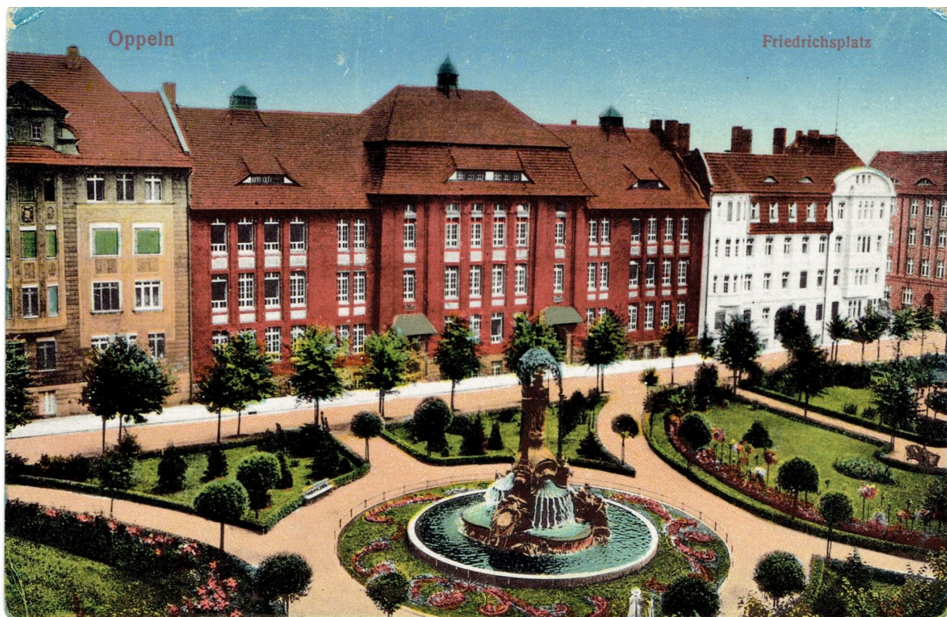
Plac I. Daszyńskiego, karta pocztowa, wyd. B. Scholz, Wrocław, ok. 1910 r.