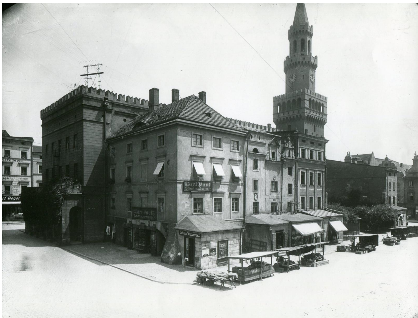
Ratusz i kamienice śródrynkowe, widok z budynku znajdującego się na rogu ul. Młyńskiej i B. Koraszewskiego, ok. 1916 r.