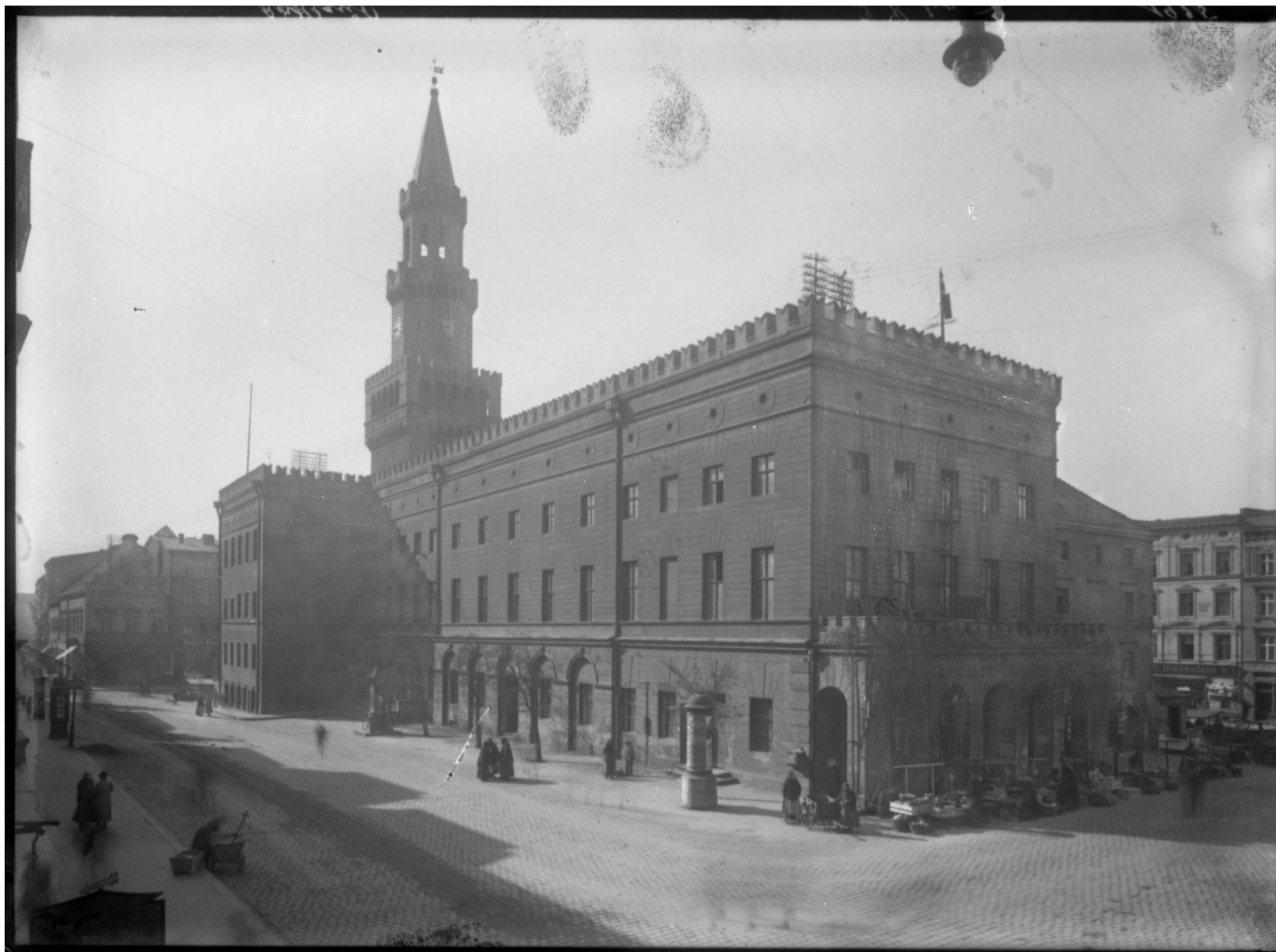
Widok od strony północno-wschodniej, ok. 1916 r.